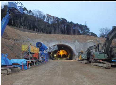
名古屋側より豊橋側を望む