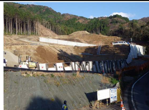
名古屋側より豊橋側を望む