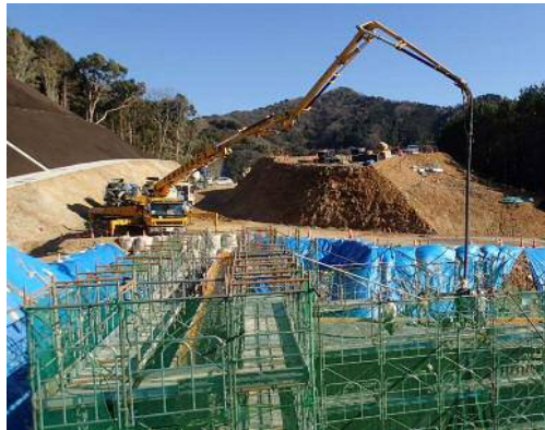
5号排水路コンクリート打設状況

平素は、国道23号蒲郡バイパス工事に関しまして、地域の皆様のご理解ご協力を賜り、心よりお礼申し上げます。 私どもの工事は、蒲郡市五井町にて、バイパス本線の山の掘削・土砂搬出及び排水路をつくる工事で、昨年6月中旬より立木の伐採を始め、7月下旬から約5万m 3 の掘削・土砂搬出を開始し、「雨にも負けず、風にも負けず…いや台風には負けました」が、順調に工事が進み、排水路2基を完成し工事はほぼ完了しました。 工事完成まで残り1か月をきりましたが、最後まで無事故・無災害記録を更新できるよう安全第一で工事を進めて参ります。 今後も、蒲郡バイパスの工事が続きますが、ご理解とご協力のほどよろしくお願い致します。