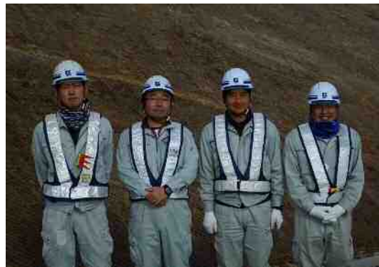
現場担当者 現場代理人 監理技術者 現場担当者