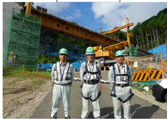
現場代理人 監理技術者 現場担当者