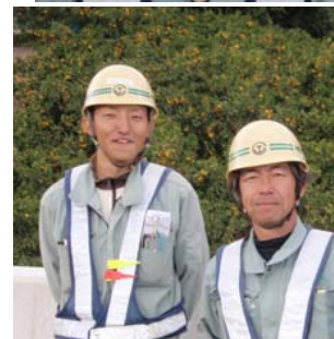
現場付近のミカン畑と中部土木(株)スタッフ

平素は、国道23号蒲郡バイパス工事に対しまして、地域の皆様のご理解ご協力を賜り心よりお礼申し上げます。 夏休みの現場見学会には多数のご参加頂き、好評で終わることが出来有り難うございました。この場をお借りして御礼申し上げます。 工事に携わってからミカンの育つ様子を日々観察させて頂いております。随分昔にミカン狩りをした記憶も微かであり、こんなに近くで毎日見れることや地域の皆様方との御縁も蒲郡BPの担当でなければ経験出来ないことであり大切にしていきたいと思っております。 季節も随分肌寒くなり、冬に向かいミカンもそろそろ収穫の時期を迎えます。地元の皆様方には御協力の中ご迷惑をお掛けすることもあると思いますが、よろしくお願い致します。 ミカンと同じ色のオレンジ色のプレートを掲げた車両で、お気付きの点があればお気軽にお申し付けください。 今後とも、スタッフ一同宜しくお願い致します。