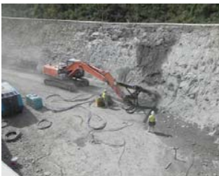
鉄筋挿入工施工状況

平素は、国道23号蒲郡バイパス工事に対しまして、格別のご理解ご協力を賜り心よりお礼申し上げます。 私共の担当する工事は、(仮)蒲郡西ICから神ノ郷トンネル付近までの延長約600mが工事区間となります。 主な工事内容は盛土工約40,000m 3 、植生工約5,000m 2 、鉄筋挿入工約1,200m、擁壁工(重力式擁壁工7箇所、補強土壁工5箇所)で、擁壁をつくり盛土をして道路の形に造成する工事です。 山あいの場所なので皆様からは見えづらい場所となっており、どこで工事しているのかとされているかもしれません。