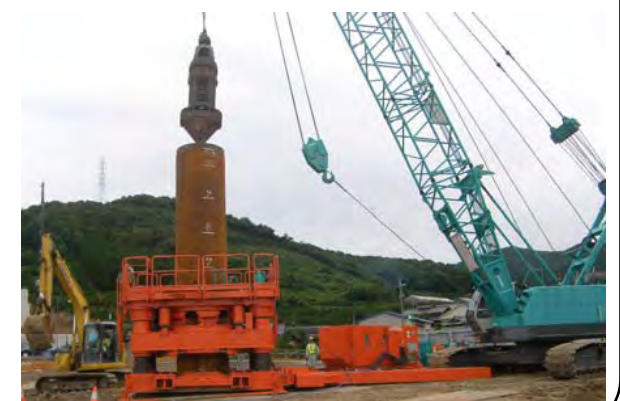
場所打杭施工状況