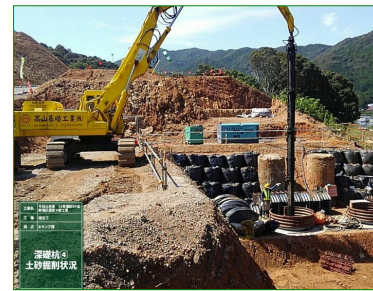
☆場所打杭施工(写真2)