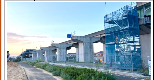
浜松側より名古屋側を望む