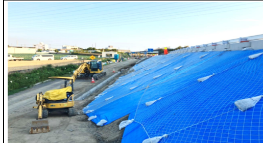
名古屋側より浜松側を望む