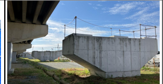
名古屋側より浜松側を望む