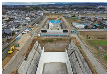
豊田IC側より勘八IC側を望む