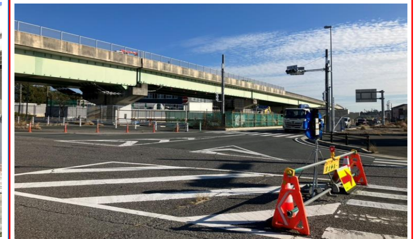
名古屋側より浜松側を望む