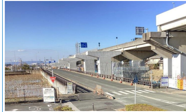
浜松側より名古屋側を望む