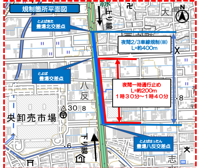
2/3車線規制箇所(※) 一時通行止め箇所

◎交通情報 (規制・渋滞)に関する問い合わせ先 日本道路交通情報センター TEL 050-3369-6623 携帯電話短縮ダイヤル #8011 ◎工事に関する問い合わせ先 国土交通省 名古屋国道事務所 防災情報課 TEL 052-853-7329 (受付時間9:15~18:00) cbr-na-dentu@mlit.go.jp 名古屋国道維持第二出張所 TEL 0568-31-7181 (受付時間8:30~17:15) cbr-na-dai2@mlit.go.jp 名古屋国道事務所ホームページ https://www.cbr.mlit.go.jp/meikoku/ 名古屋国道事務所ツイッター https://twitter.com/mlit_meikoku 名古屋電機工業株式会社 中部支社 TEL 080-1627-4414 (終日)