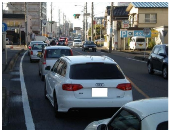
国道153号 豊田市陣中 (整備前)