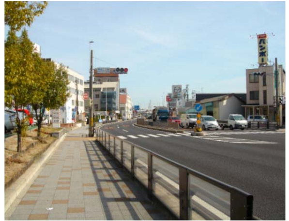
星崎電線共同溝（整備後）