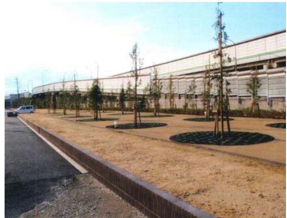
国道23号 モデル地区 環境施設帯整備

● 国道153号 愛知153号豊田地区環境対策 (豊田市久保町～陣中町 L=0.7km) 豊田市中心市街地内の国道153号において、2車線区間のボトルネック対策による円滑な交通の確保により、沿道環境の改善と交通混雑の緩和、交通安全の向上を目的に事業を行っています。