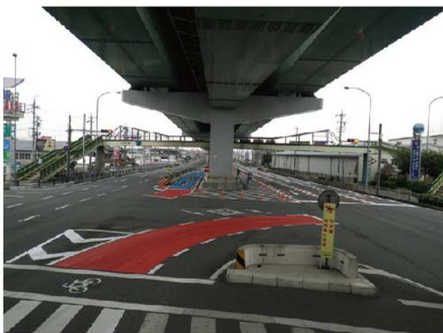
国道41号(小牧市外堀)