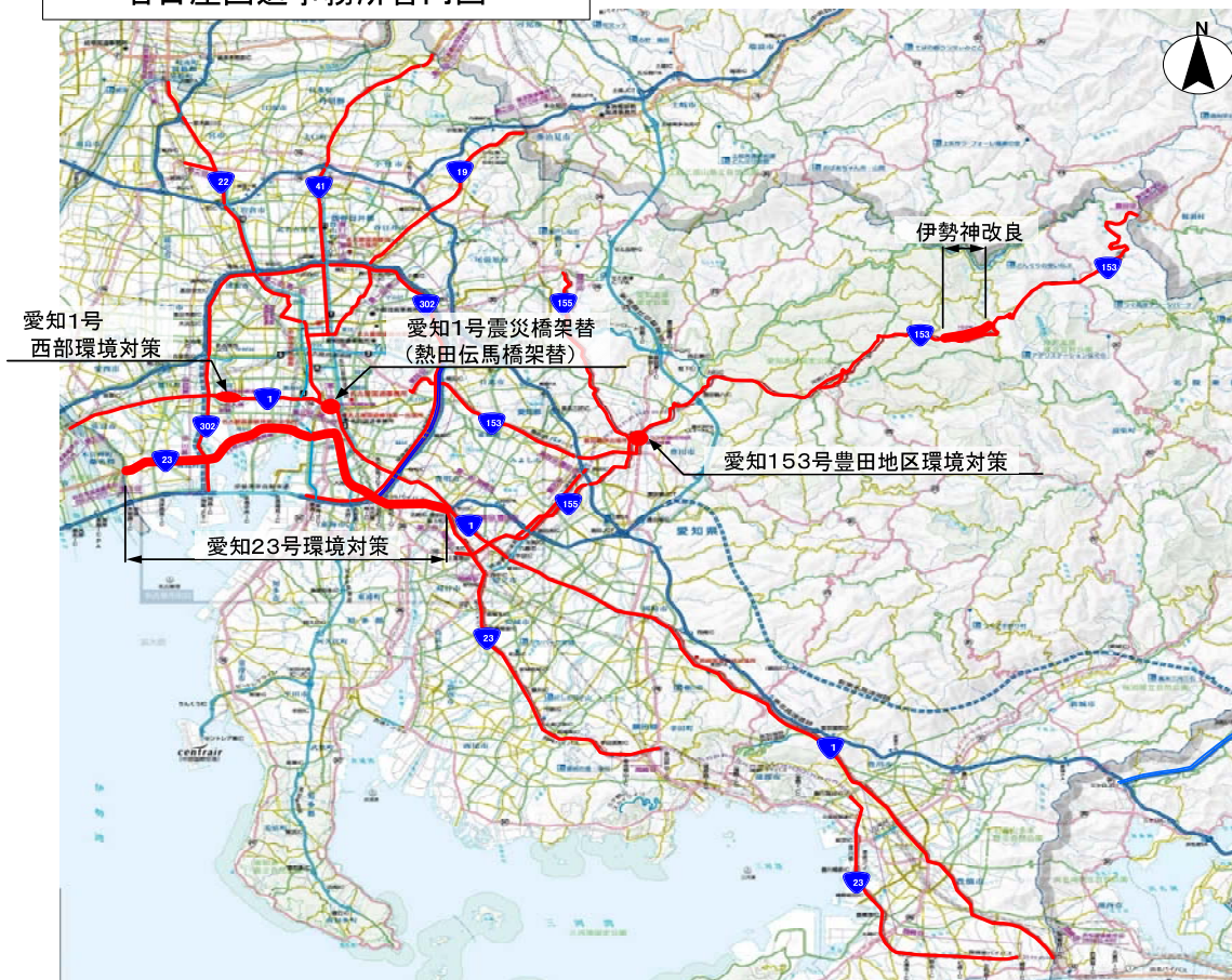
名古屋国道事務所管内図