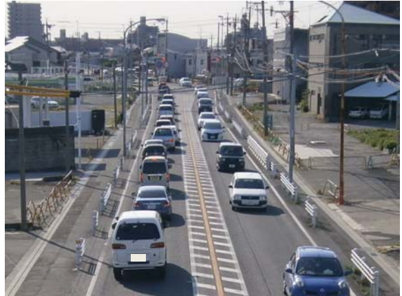
国道1号 中川区下之一色地区 (整備前)

● 国道23号 愛知23号環境対策 (豊明市阿野町 ～弥富市栄南町 L=29.2km) 国道23号名古屋市南部地区の沿道環境の悪化を改善するため、大気・騒音対策を目的とした環境施設帯整備等を行っています。