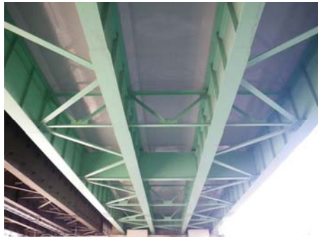
【床版補修（剥落防止）】