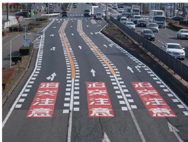
国道22号(一宮市東島)