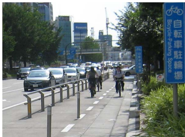
国道19号(名古屋市中区)