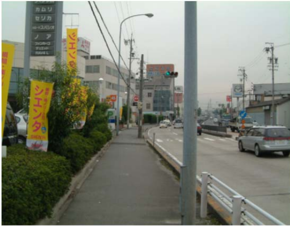
星崎電線共同溝（整備前）