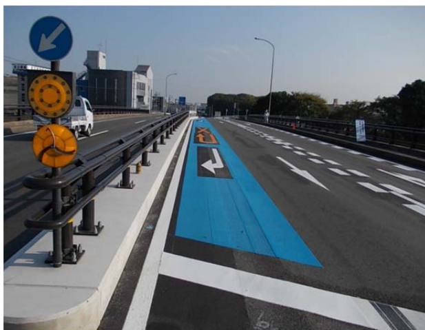
国道1号(知立市逢妻町)