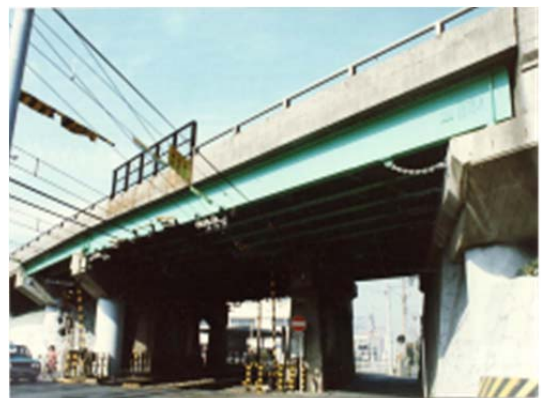
国道1号熱田伝馬橋（現況）