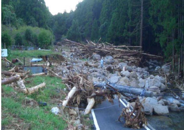
被災した熊野市井戸地区(市道「大馬1号線」)における現地調査状況及び被災状況