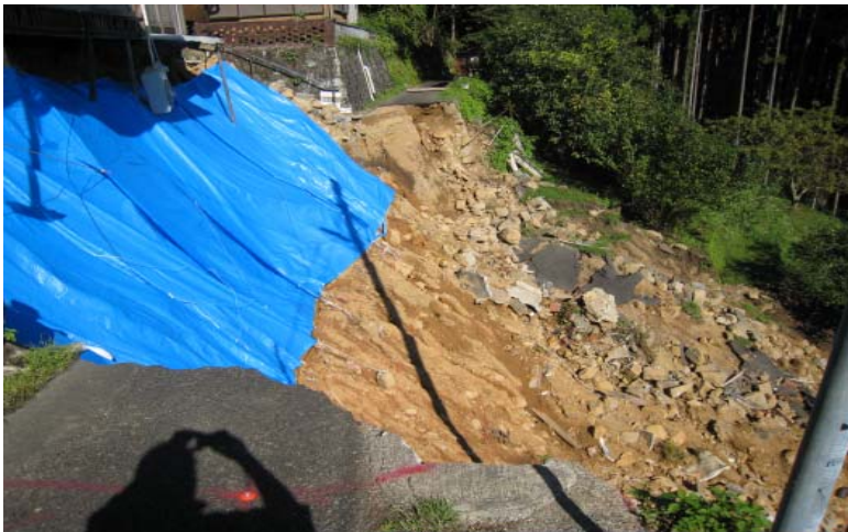
市道「新田切立線」の被災状況