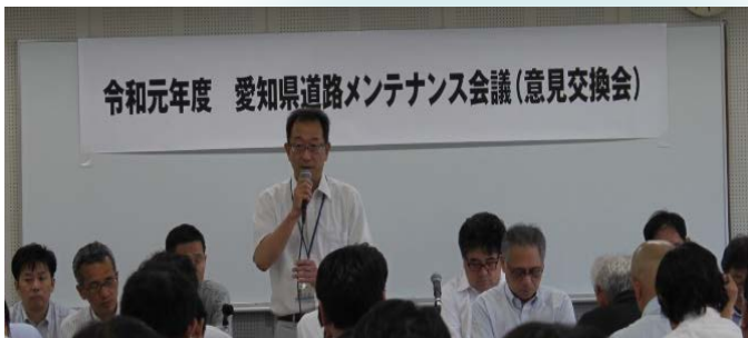
挨拶(名古屋国道事務所 副所長)