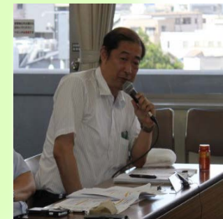
市町村などの実務担当者からの発言