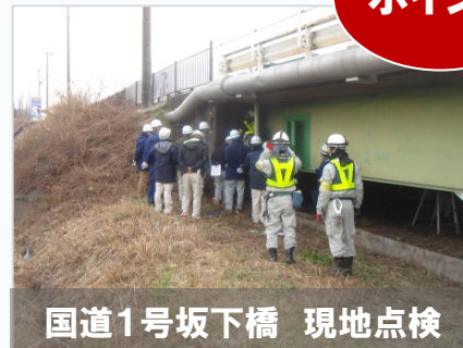
国道1号坂下橋 現地点検