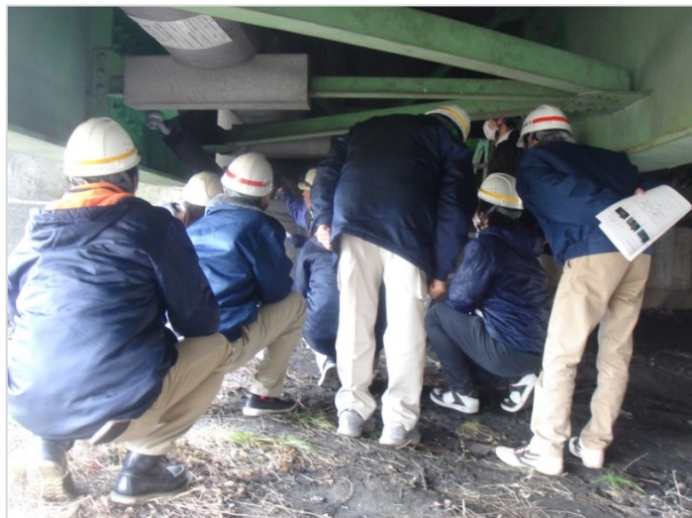
【写真】坂下橋の支承部を確認する参加者。 研修中も何台ものトラックが通過していきました。