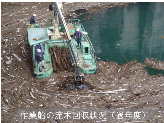
作業船の流木回収状況（過年度）