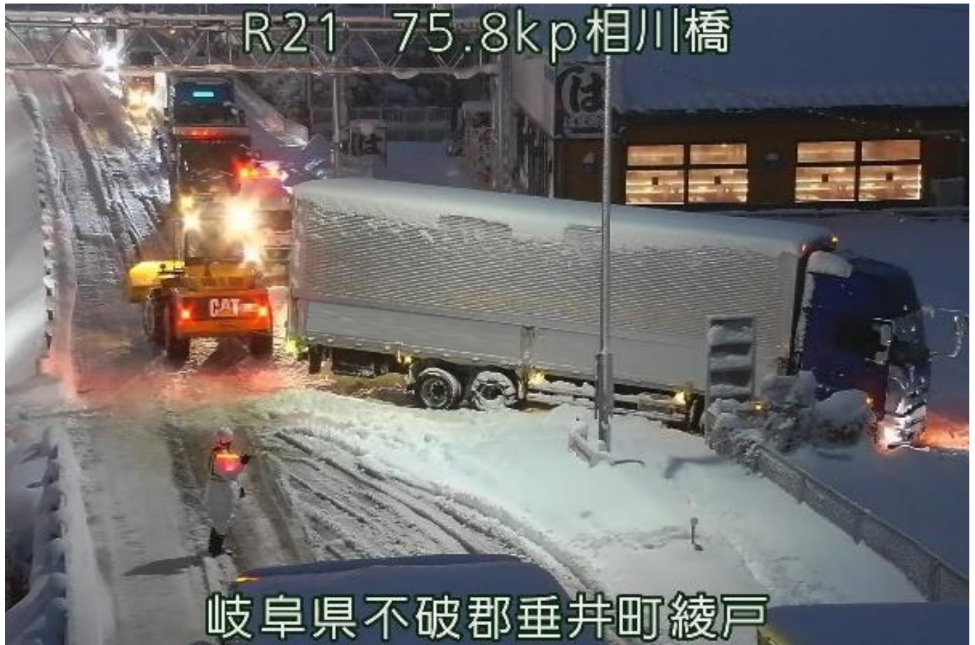
国道21号での積雪による滞留 〈R6.1.24 垂井町綾戸〉