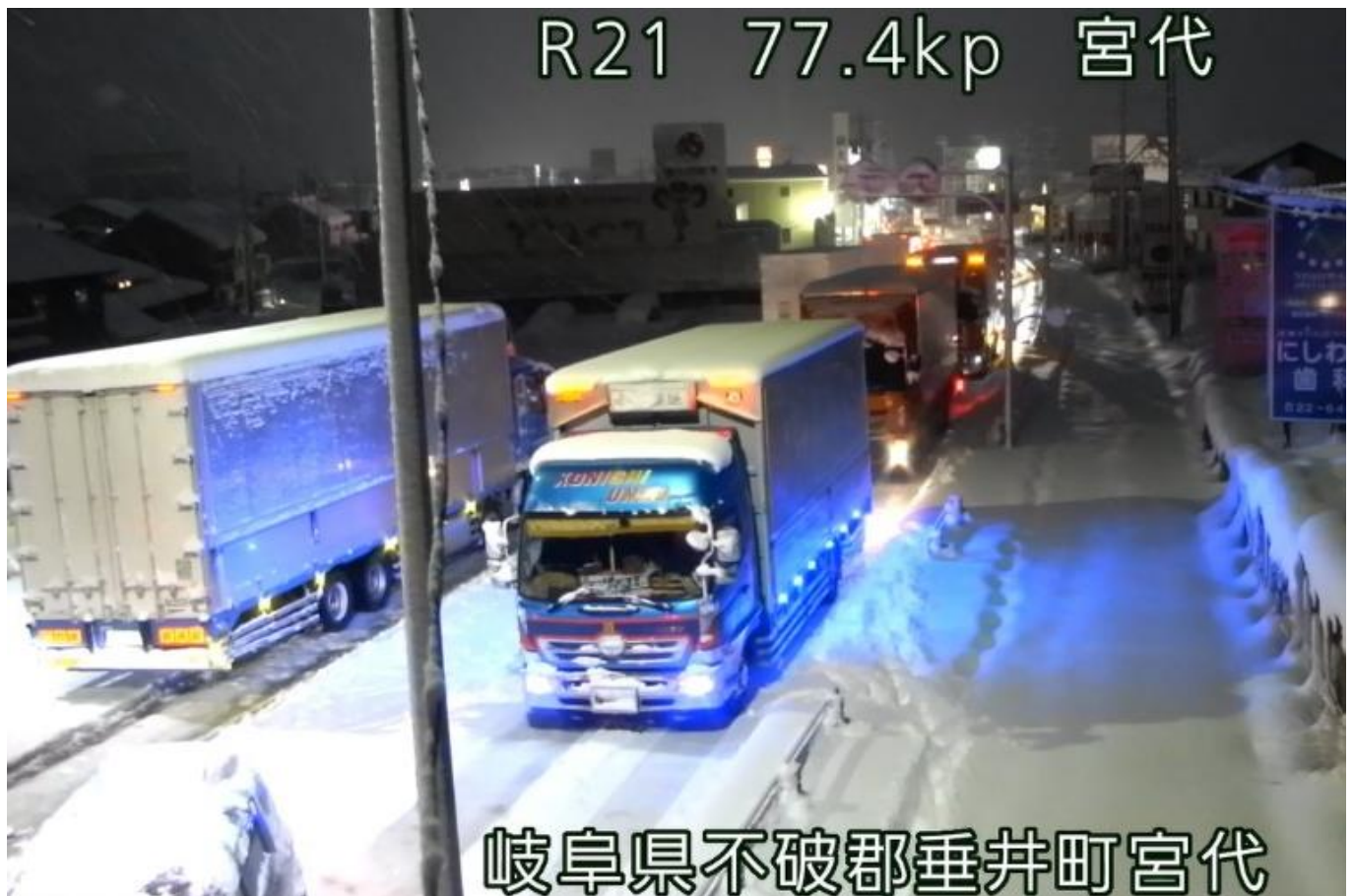
国道21号での積雪による滞留 〈R6.1.24 垂井町宮代〉