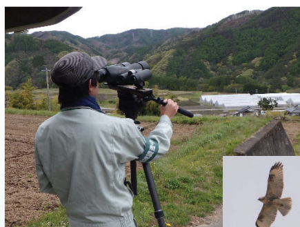
猛禽類調査の状況

美和ダムの湖内堆砂対策施設の試験運用開始にあたり、下流の河川環境のモニタリングと周辺に生息する猛禽類への影響を把握する業務です。