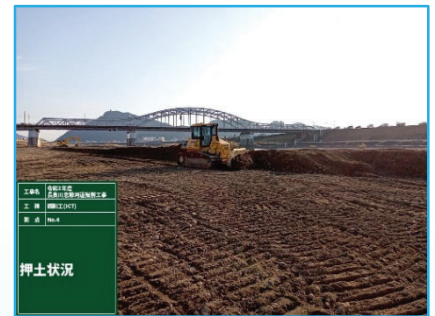
＜ 施工状況 ＞