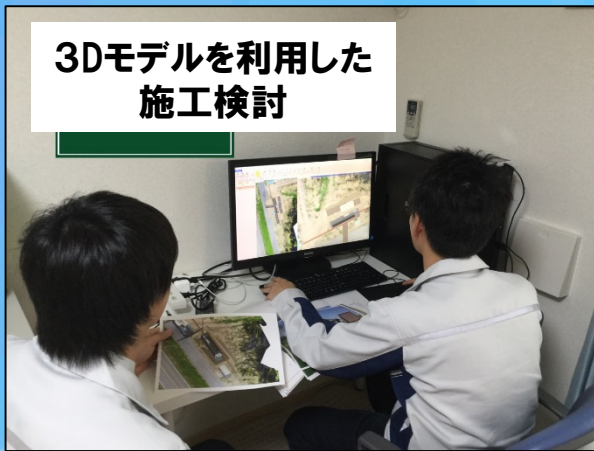
3Dモデルを利用した 施工検討