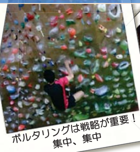
ポルタリングは戦略が重要！ 集中、集中