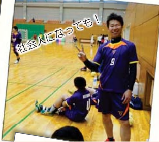
社会人になっても！