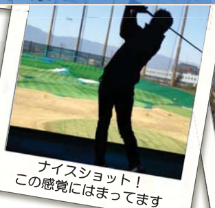
ナイスショット！ この感覚にはまっています