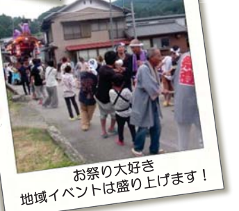
お祭り大好き 地域イベントは盛り上げます！