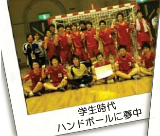
学生時代 ハンドボールに夢中