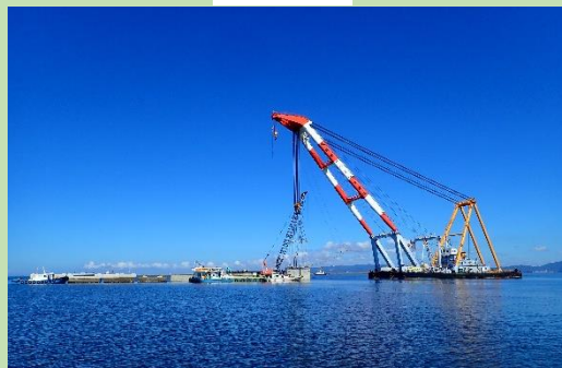
起重機船によるケースン据付状況 (6月頃予定)