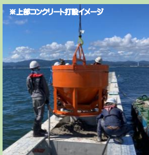
上部コンクリート打設状況 (5月~7月頃)