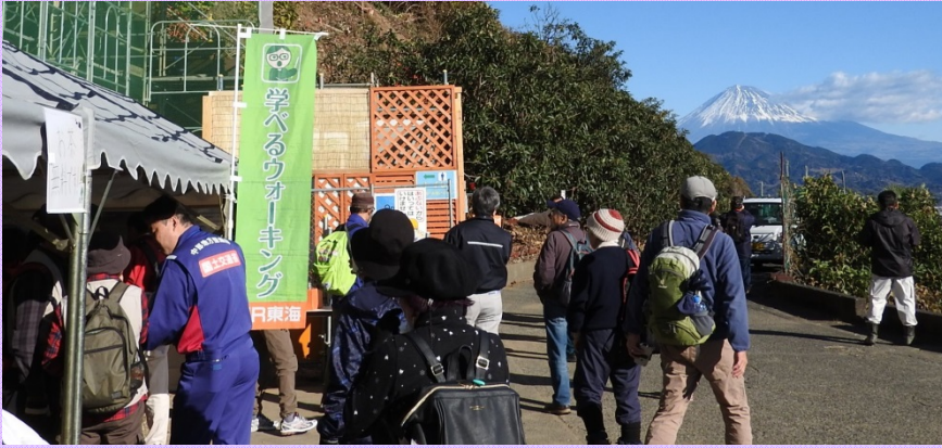
12月17日 JR東海さわやかウォーキング企画「学べるウォーキング」とコラボ 由比薩埵峠で土砂災害の歴史と地すべり対策事業を説明 (富士砂防事務所)