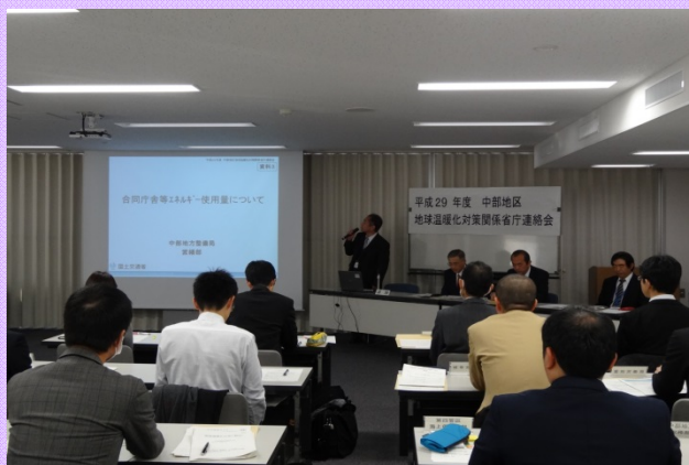
11月27日 平成29年度 中部地区地球温暖化対策関係省庁連絡会を開催 合同庁舎におけるエネルギー使用量について 説明する様子(共用大会議室) (営繕部調整課)