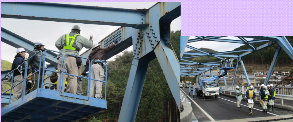
12月1日 橋梁点検講習会(飛騨地域) 飛騨地域の自治体職員を対象とした橋梁点検講習会を開催しました (高山国道事務所)