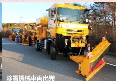
除雪機械車両出発