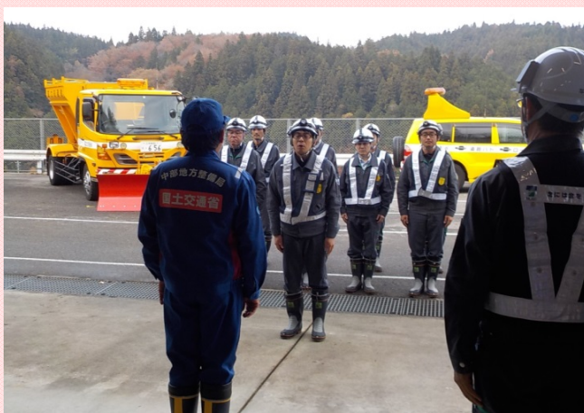
11月30日 平成29年度 国道153号雪氷対策出発式を稲武雪寒基地にて行いました (名古屋国道事務所)