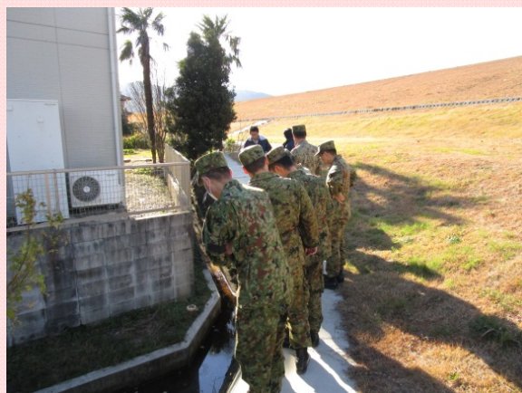
海津市脇野地先での漏水箇所状況を巡視