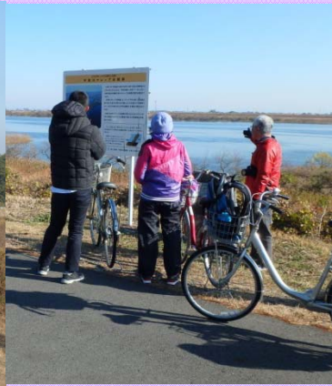
12月7日 愛西市 自転車走行社会実験 土木遺産 ケレップ水制などを自転車で周遊、 木曾川と長良川の中堤など約20kmを走りました。 (木曾川下流河川事務所)