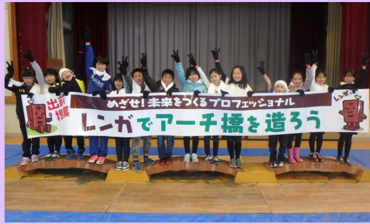
12月8日 伊勢市立豊浜東小学校出前授業

子ども達に「ものづくり」を通し、道路管理や橋の耐震補強(建設業)に興味を持ってもらうことを目的に出前授業を実施 (三重河川国道事務所)