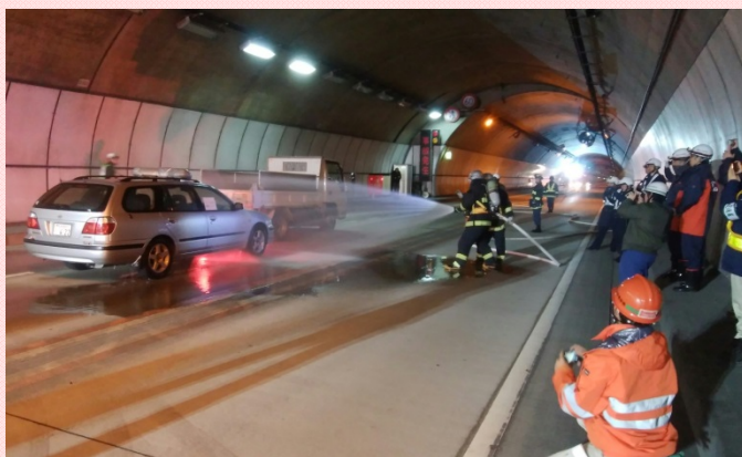
12月8日 合同大規模事故対応訓練 三遠南信自動車道の矢筈トンネル内にて、合同大規模事故対応訓練を実施しました。 (飯田国道事務所)