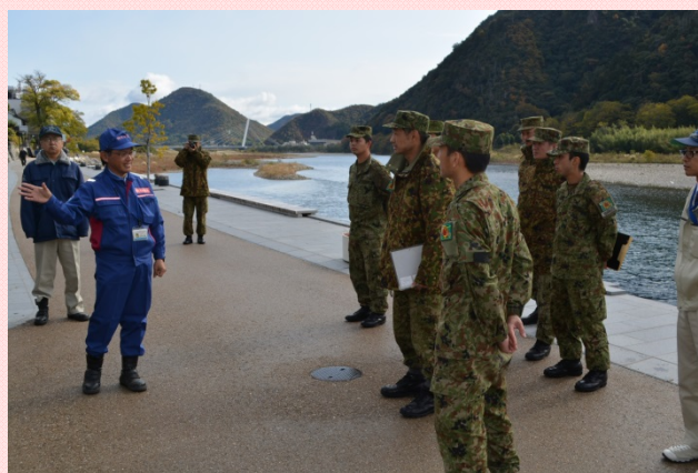
11月16日 国土交通省と陸上自衛隊が重要水防箇所等の合同巡視を実施 洪水時に甚大な被害が予想される箇所を確認 (長良川:岐阜市内) (木曾川上流河川事務所)