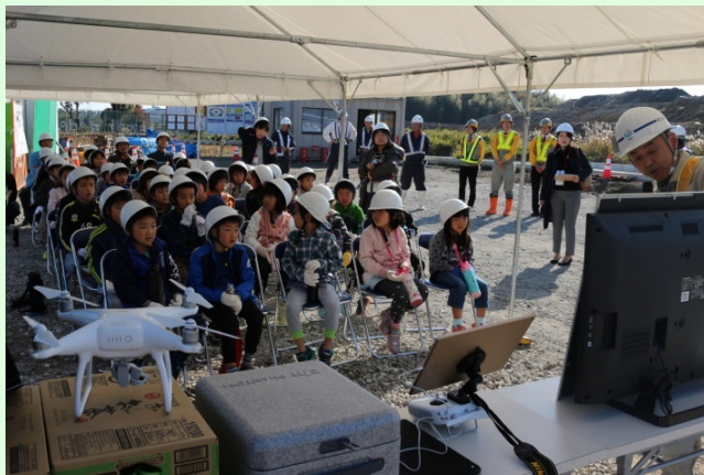
鈴鹿市立天名小学校 1・2年生 概要説明風景