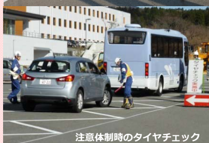
注意体制時のタイヤチェック