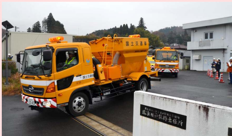
12月8日 瑞浪国道維持出張所にて雪寒対策出陣式を実施 国道19号恵那雪寒倉庫に向かって出発します (多治見砂防国道事務所)