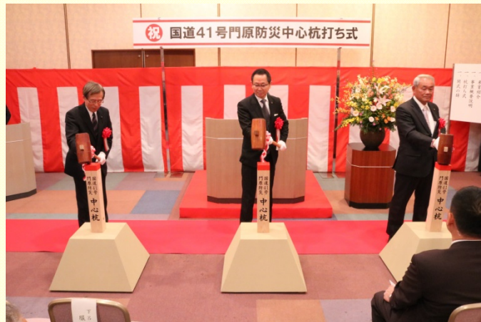
11月30日 国道41号門原防災中心杭打ち式を開催 杭打ちを行う下呂市長(中)ら地元関係者。