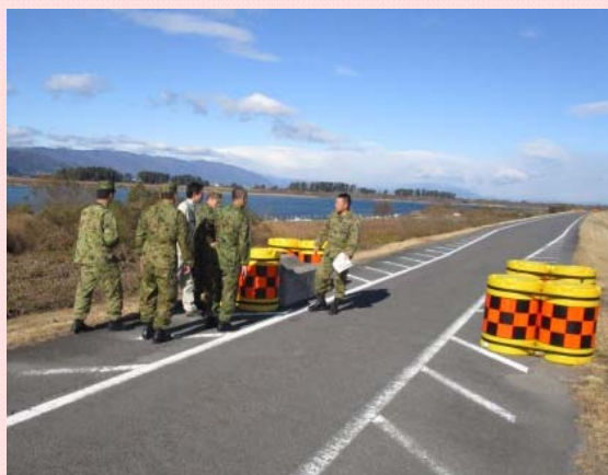
愛西市葛木地先での有事の際の車両通行可否の確認