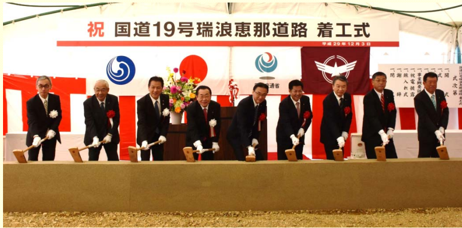
12月3日 国道19号瑞浪恵那道路着工式 国道19号瑞浪恵那道路着工を記念した鍬入れ式瑞浪市土岐町鶴城交差点 (多治見砂防国道事務所)