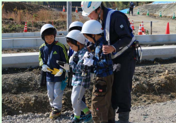
スマートフォンを使用した測量体験