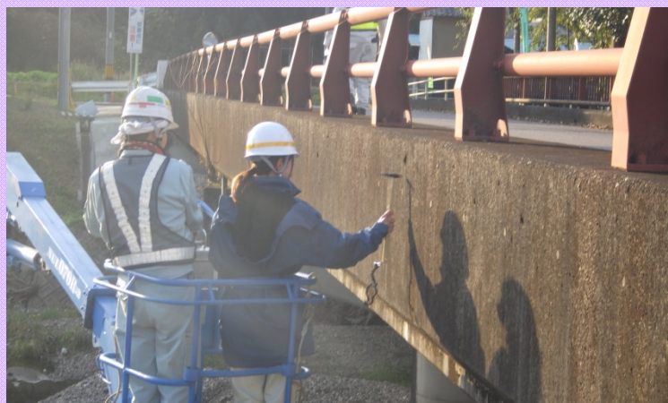
11月17日 橋梁点検講習会 自治体職員に対して技術力向上のため、実際の現場で点検講習を実施 (岐阜国道事務所)