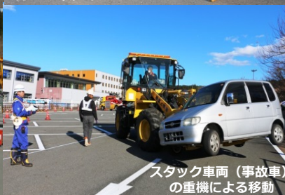
スタック車両（事故車） の重機による移動