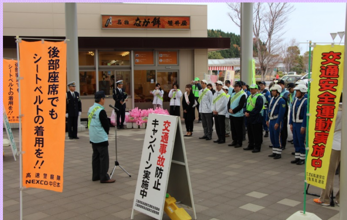
12月4日 年末の交通安全キャンペーン(亀山PA) 開会式並びに安全運転の呼びかけ及び啓発物の配布の様子 (北勢国道事務所)