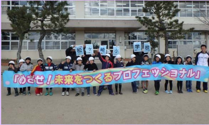
12月14日 松阪市立松ヶ崎小学校出前授業