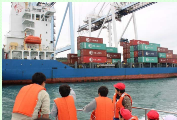
業務艇「まさき」に乗船し、 袖師コンテナターミナルを見学