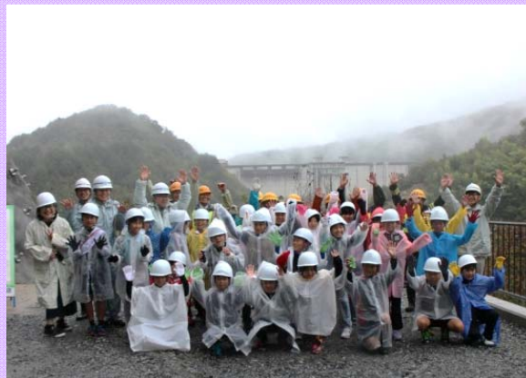
小里川ダムをバックに記念撮影しました

10月16日 瑞浪市立陶小学校の児童が小里川ダム1日工事検査官を体験しました (庄内川河川事務所)