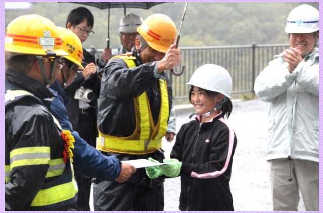
「検査合格！」 検査結果通知書を小学生から請負者に交付しました