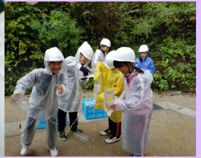
3種類の実験装置で河川・砂防・ダムについて学習しました