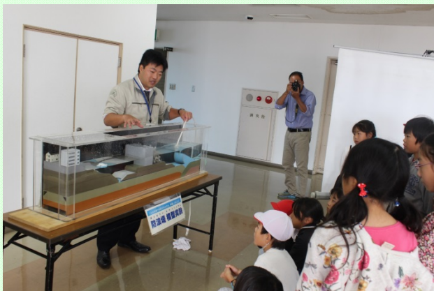
職員からの防波堤効果を説明に聞き入る児童たち (清水マリビル7階展示室)