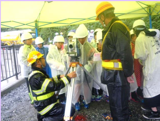
測量機器での工事検査体験をしました