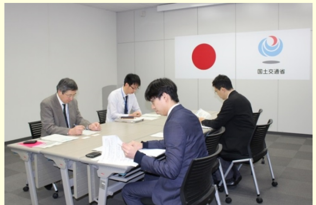
報道関係者への審議内容を説明