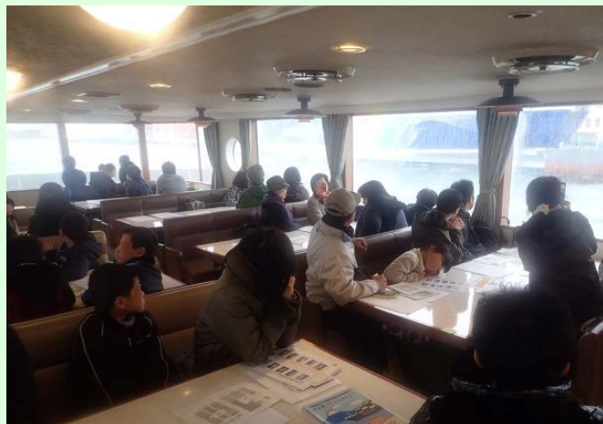
3月21日 春休み 清水港見学会を開催 参加者がベイ・プロムナード船内から清水港を見学する様子 (清水港湾事務所)