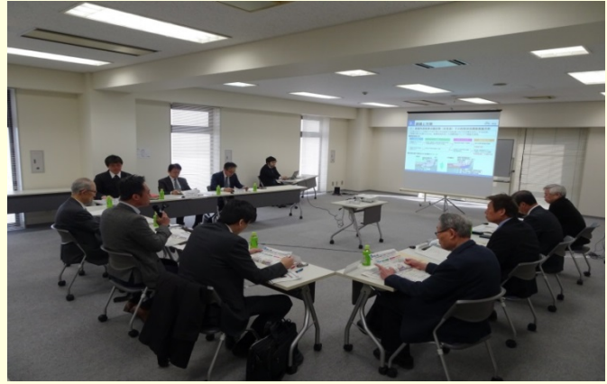
3月7日 名古屋国道管内自転車安全利用協議会を開催しました ～自転車ネットワーク整備の推進～ (名古屋国道事務所)