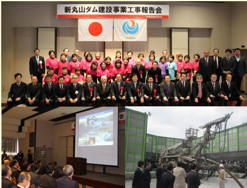
3月4日 新丸山ダム建設事業工事報告会を開催 新丸山ダム本体工事に関わる転流工事をはじめとする工事進捗と、 ダム事業を通じた地域振興に対する取組を報告しました。 (新丸山ダム工事事務所)