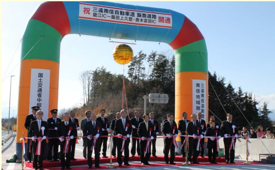
3月10日 三遠南信自動車道飯喬道路 開通式 国道474号三遠南信自動車道飯喬道路、龍江IC～飯田上久堅・喬木富田IC間 開通式でテープカットを行いました (飯田国道事務所)