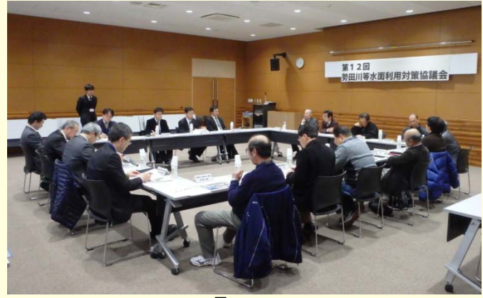
2月23日 第12回勢田川等水面利用対策協議会を開催(三重県伊勢庁舎) 不法係留船ゼロを目標として平成21年に協議会を設立。 構成委員が一堂に会し、意見交換を行いました (三重河川国道事務所)