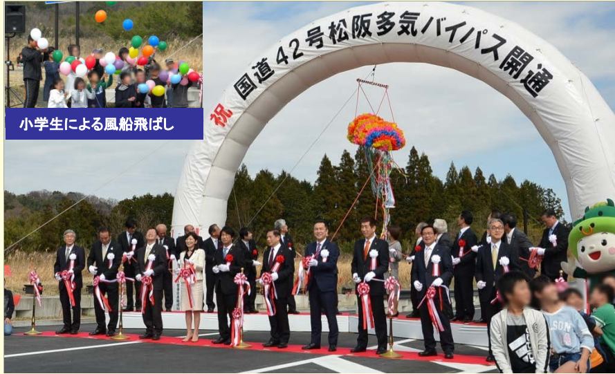
3月18日 国道42号松阪多気バイパス 開通セレモニー 国会議員・三重県知事・関係市町の首長等によるテープカット