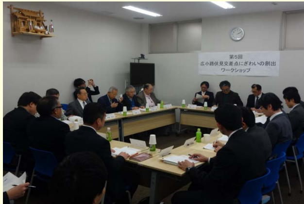
3月7日 広小路伏見交差点にぎわいの創出WSを開催しました ～新たなにぎわい空間の実現に向けて～ (名古屋国道事務所)