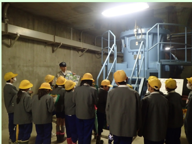
3月5日 金草川排水機場の見学会を実施 養老町立養老小学校4年生の児童を対象に、 出水時に働く施設を見学(【写真】ポンプ室) (木曾川上流河川事務所)