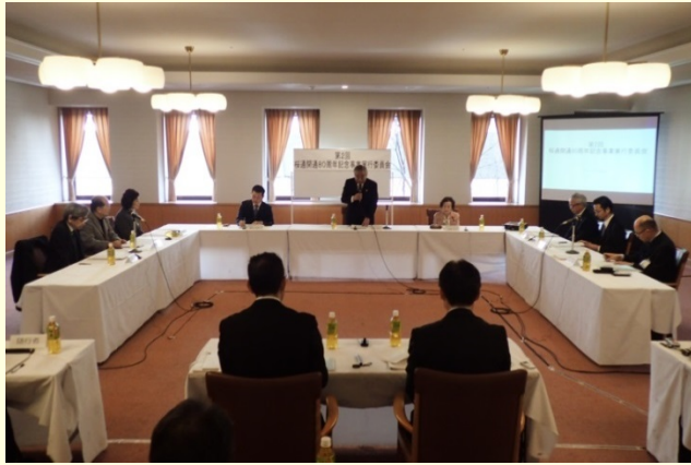
3月15日 桜通開通80周年記念事業実行委員会(第2回)を 開催しました ～桜通の歩行者空間再編計画を決定～ (名古屋国道事務所)