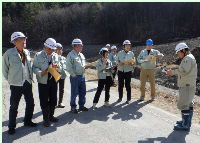
3月14日 砂防事業視察 大鹿村長と大鹿村議会議員 7名が、 「塩川第2砂防堰堤工事」の現場を視察しました (天竜川上流河川事務所)