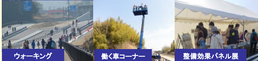
3月4日 国道42号松阪多気バイパス 全線開通記念イベント 開通前の松阪多気バイパスで、土性選手と幼稚園児の綱引きや 働く車コーナー等のイベント、整備効果のパネル展を実施しました (紀勢国道事務所)