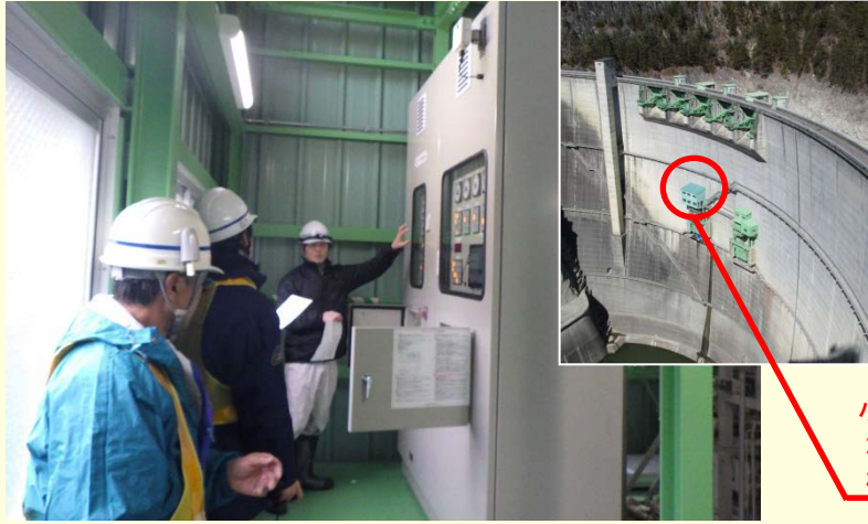
小渋ダム コンジットゲート1号 機側操作室