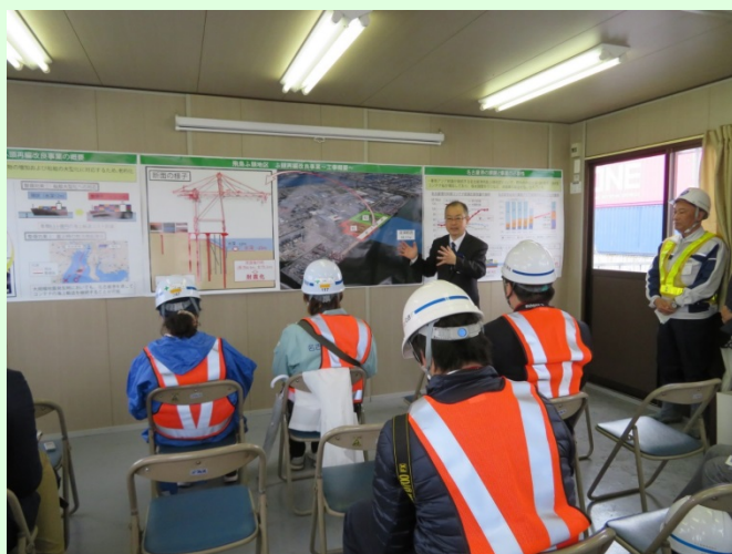
名古屋港湾事務所長による事業概要の説明