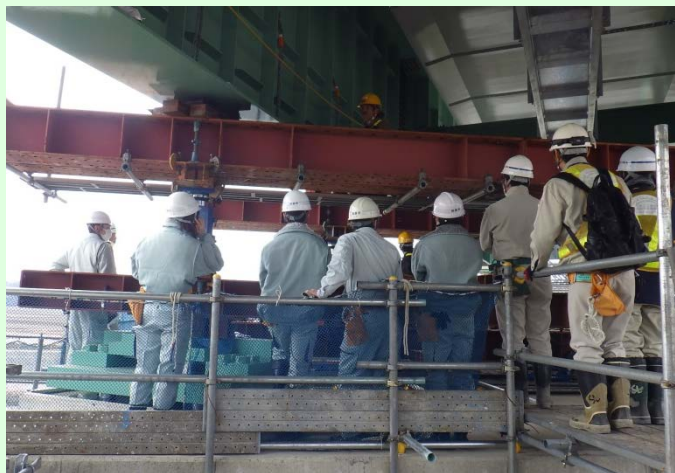
3月19日 中勢バイパス現場見学会 鈴鹿市職員が中勢バイパス中ノ川高架橋の 架設現場を見学 (三重河川国道事務所)