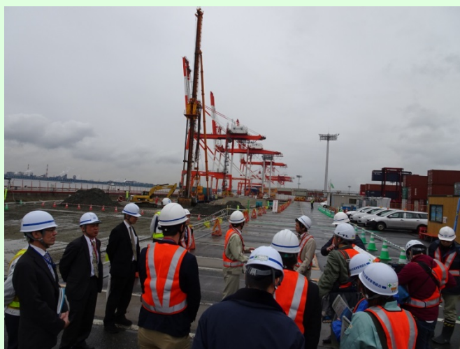
工事現場見学の様子