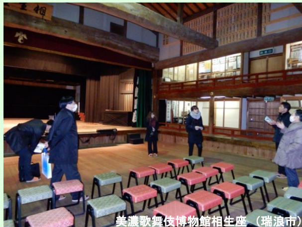
美濃歌舞伎博物館相生座 (瑞浪市)