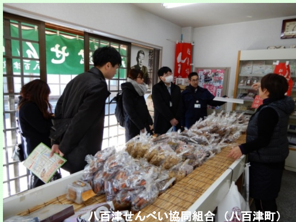
八百津せんべい協同組合 (八百津町)