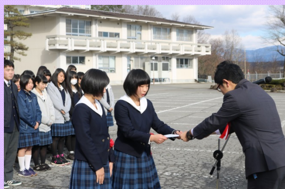
飛騨高山高校の代表者へ 雪またじ運動のモニター委嘱状を交付しました