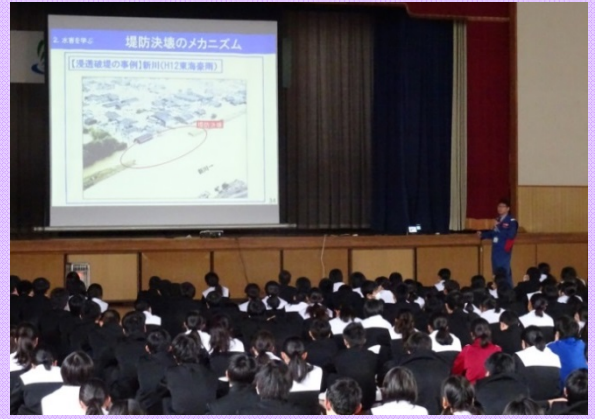
1月11日(木)・1月17日(水) 岐阜県海津市立城南中学校1年生(写真左)・岐阜県海津市立平田中学校全校生徒(写真右) を対象とした「防災講座」を開催 大規模水害に対し「逃げ遅れゼロ」を目指すための防災講座の実施風景 (木曾川河川下流事務所)