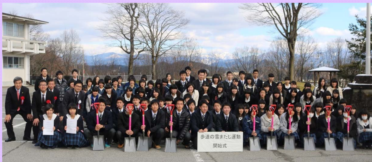
飛騨高山高校の生徒と集合写真