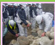
石張り護岸工法の体験