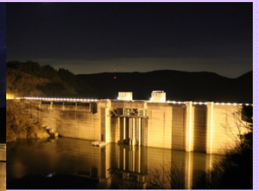
12月22、23日 おりがわダム ライトアップ ライトアップを楽しむ参加者