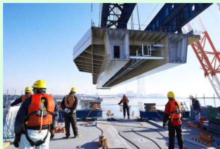
12月23日 四日市港霞4号幹線の見学会を開催 最後となる巨大橋桁の海上架設の様子を見守り無事架設が完了しました (四日市港湾事務所)