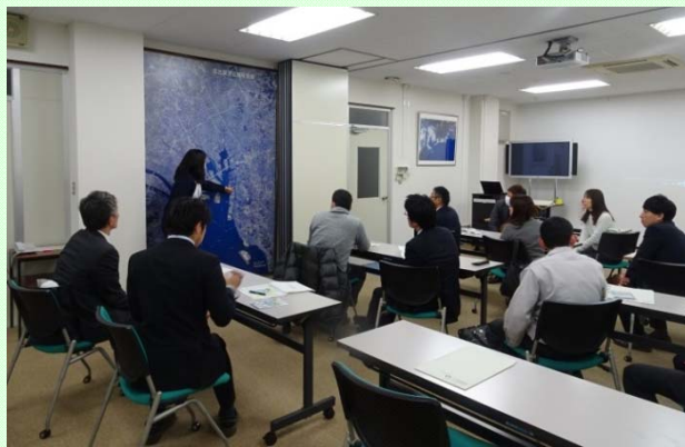
1月10日 御前崎港整備促進期成同盟会が名古屋港を視察 名古屋港湾事務所会議室にて職員より 名古屋港の概要の説明を受ける (名古屋港湾事務所)