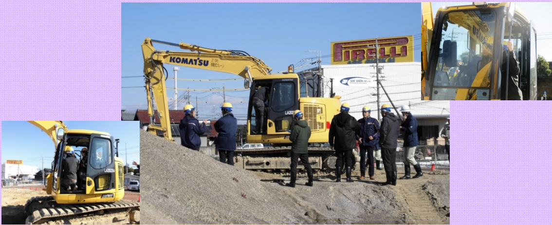
12月21日 建設ICT(クイックスマートコンストラクション)講習を受講 女性技官もチャレンジ!“建築基礎工事もスマートに”「建設ICT土工講習会」を受講しました (営繕部)