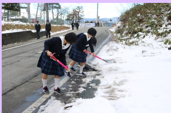
雪またじのデモンストレーションの様子