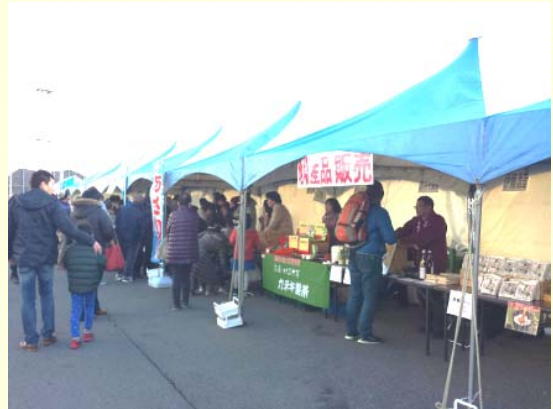
1月2日 四日市港にコスタ ネオロマンチカ初入港 船内でセレモニーを実施、多数の市民でふ頭が賑わう