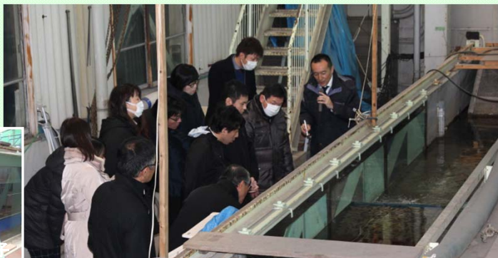
1月10日 御前崎港整備促進期成同盟会が伊勢湾水理環境実験センターを見学 津波を発生させて、御前崎港の粘り強い防波堤の効果を確認する実験を見学 (名古屋港湾空港技術調査事務所)