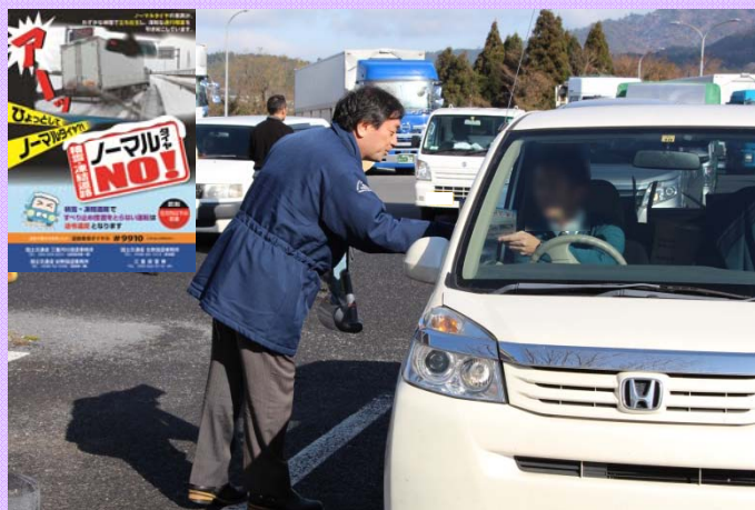
12月15日 冬用装備の装着を呼び掛け 道の駅がにて道路利用者等に冬用装備装着の呼びかけのためチラシを配布しました (北勢国道事務所)