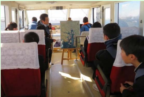
1月24日 名古屋市立扇台中学校 船に乗って名古屋港内を見学 (名古屋港湾事務所)