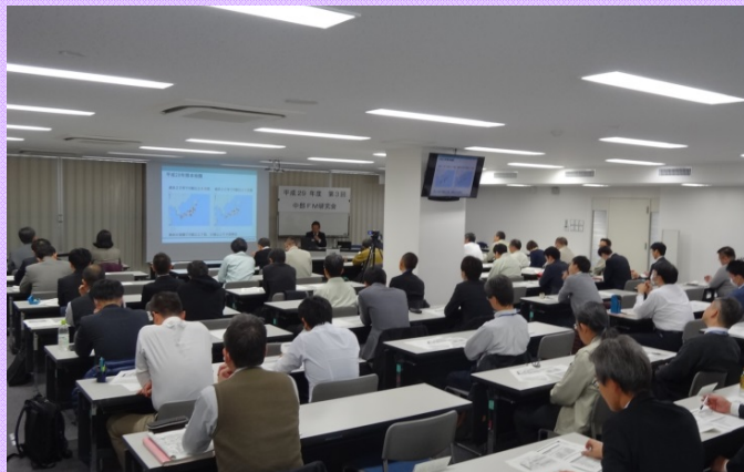
12月14日 名古屋第2合同庁舎で「第3回中部FM研究会」を開催 「ファシリティリスクの評価手順」 ～ 正しいクライテリアの設定で、被災は最小限にできる ～ (営繕部)