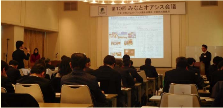
1月16日 「第10回みなとオアシス会議」(静岡県静岡市)を開催しました 講演後の「みなとオアシス制度」に関する質疑状況 (海洋環境・技術課)