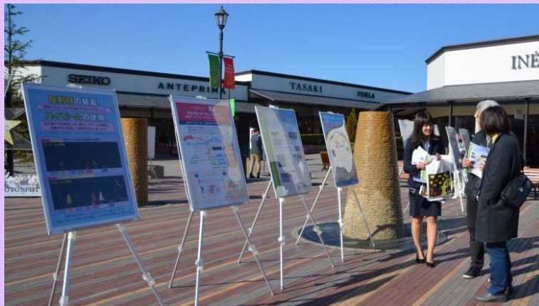
12月22日 土岐プレミアムアウトレットで広報活動 年末年始、土岐プレミアムアウトレット付近の渋滞を避ける裏ワザチラシを配布 (多治見砂防国道事務所)