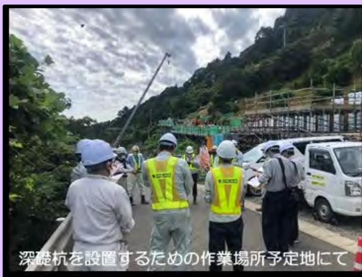
深礎杭を設置するための作業場所予定地にて