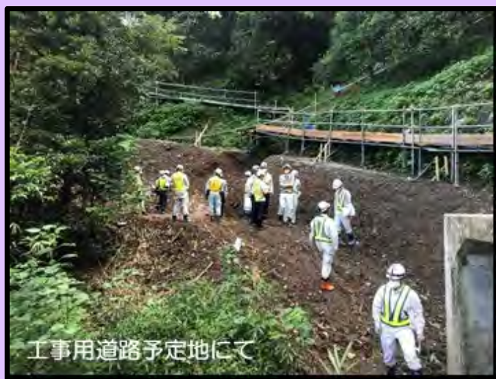
工事用道路予定地にて