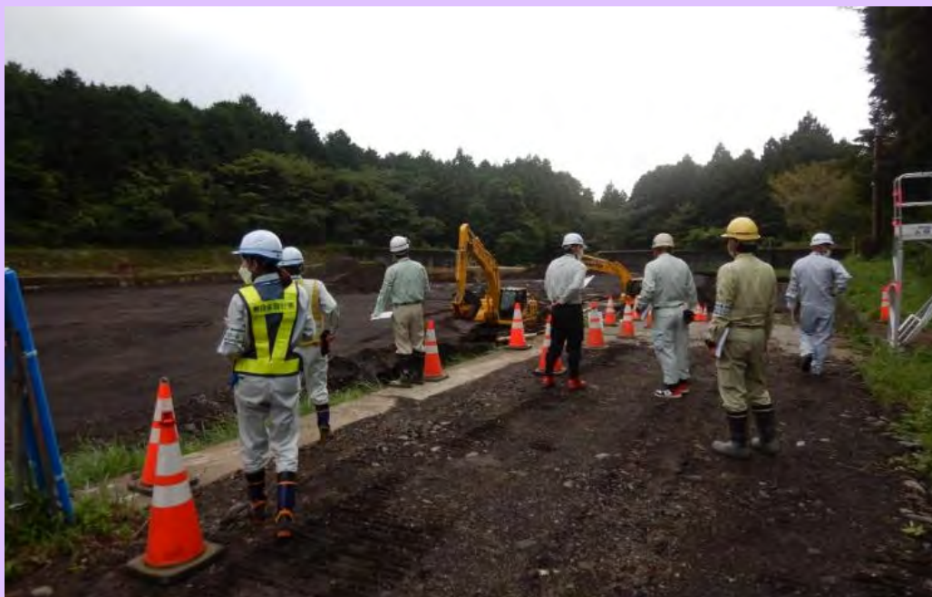
9月21日(水) 富士宮地区安全パトロールを実施

富士宮砂防出張所管内の工事現場において、安全パトロールを行いました。台風14号では大きな被害はありませんでしたが、今後の台風襲来に備え、資機材の流出や飛散が発生しないように確認を行いました。(静岡県富士宮市) 【富士砂防事務所】