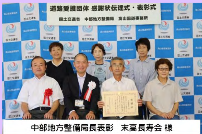
中部地方整備局長表彰 末高長寿会様