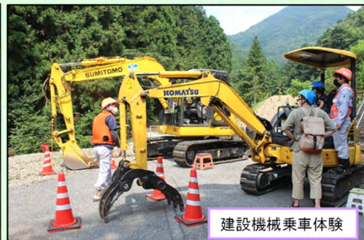
建設機械乗車体験

8月9日(火)～8月10日(水) 「夏休み特別教室」親子で大規模堰堤工事の迫力を体感！！を実施