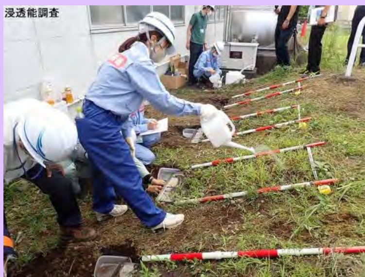
8月19日(金) 降灰量・浸透能調査の演習を実施

富士砂防事務所において、富士山火山噴火時に土砂災害防止法に基づき国土交通省が行う緊急調査の演習として降灰量調査、浸透能調査の手順の確認をしました。当事務所を含め、中部地方整備局の砂防事務所職員が参加しました。 (静岡県富士宮市)