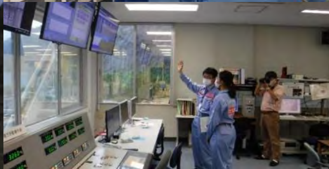
8月4日(木) 一日管理所長体験を実施

中学生が一日管理所長として、ダム堤体内やゲートの点検、湖面巡視やダム湖の水質調査をおこないました。(愛知県豊田市) 【矢作ダム管理所】