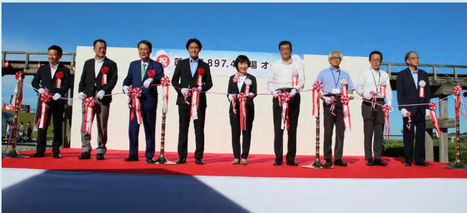
7月30日(土) 蓬莱橋897.4広場オープニングセレモニーを開催