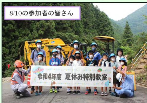
8/10の参加者の皆さん

～【夏休み特別教室】小学生に、砂防や建設業のことを知り関心を持ってもらうために～