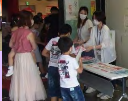
意見集・パンフレット配布の様子