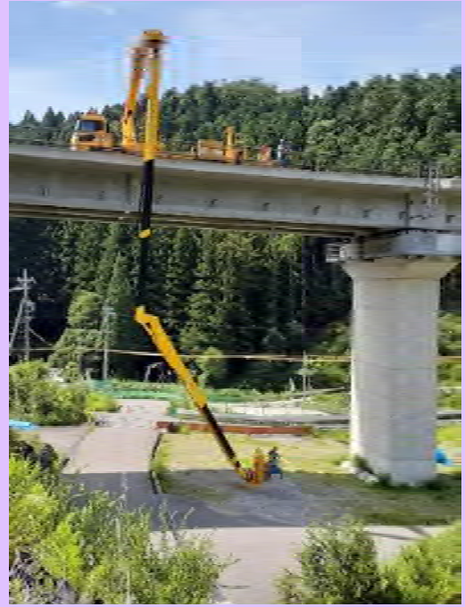
8月2日(火) 橋梁点検車の機能確認を実施

設楽ダム建設に向けて整備された橋梁を使用してバケット式橋梁点検車の機能確認を実施しました。今後は実際に供用中の橋梁の維持管理で活躍する予定です。(愛知県設楽郡)