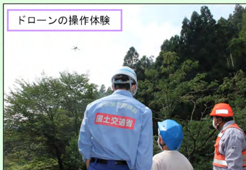
ドローンの操作体験