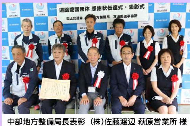
中部地方整備局長表彰 (株)佐藤渡辺 萩原営業所様