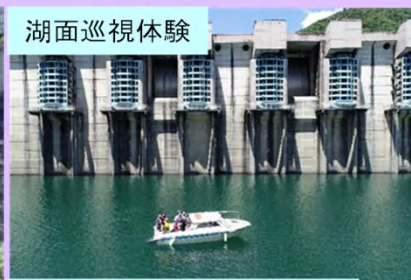
ダム見学(コンジットゲート)