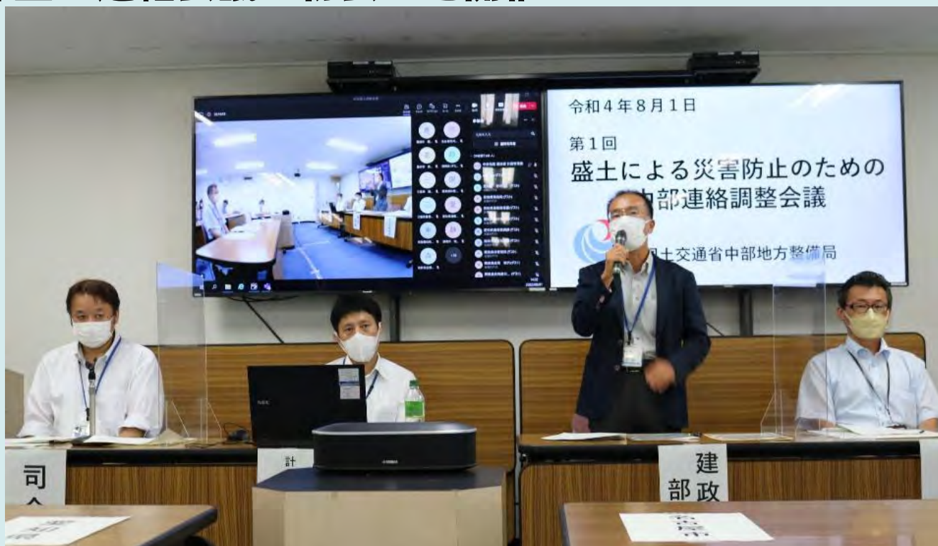
8月1日(月) 第1回 盛土による災害防止のための中部連絡調整会議(中部盛土連絡会議)を開催

盛土規制に関する中部管内の関係機関相互の緊密な連携と協力を図ることを目的とし『中部盛土連絡会議』の第1回会合を開催。(愛知県名古屋市)