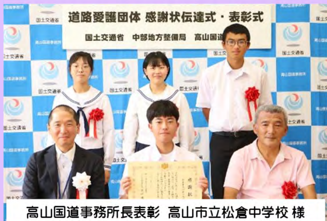
高山国道事務所長表彰 高山市立松倉中学校様