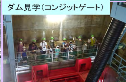
ダム見学(コンジットゲート)