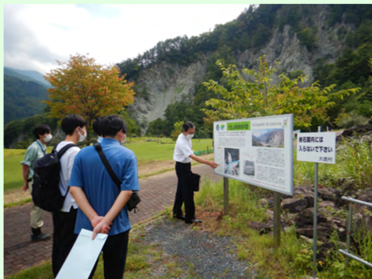
大西山公園の三六災害崩壊地跡