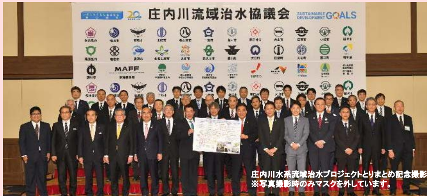
庄内川水系流域治水プロジェクトとりまとめ記念撮影 ※写真撮影時のみマスクを外しています。