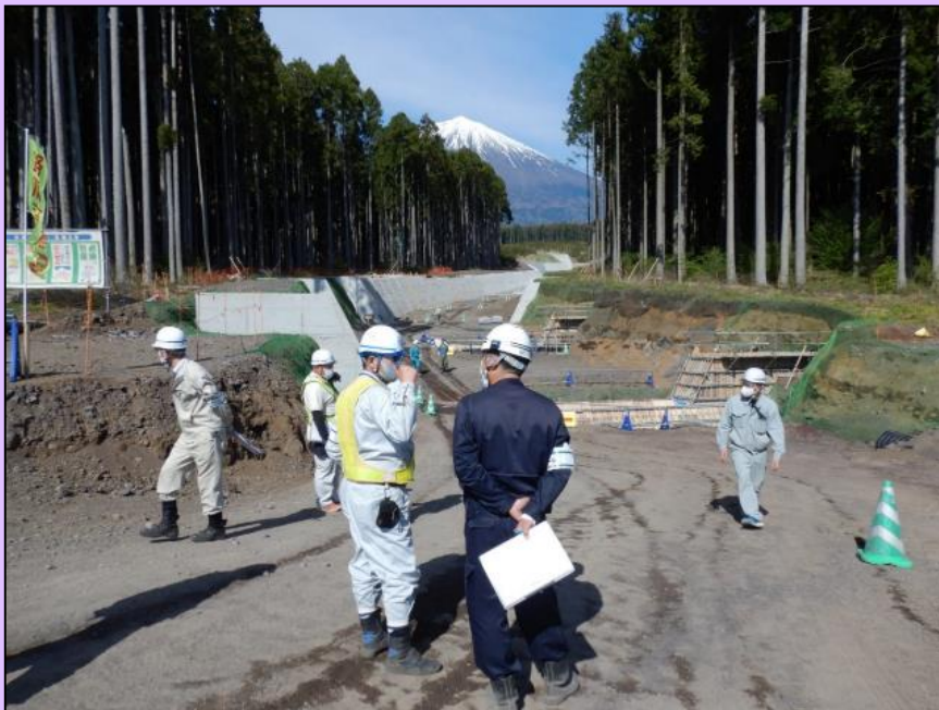
4月22日(木) 管内工事安全パトロール

富士宮砂防出張所管内の工事現場の安全パトロールを行いました。(静岡県 富士宮市)