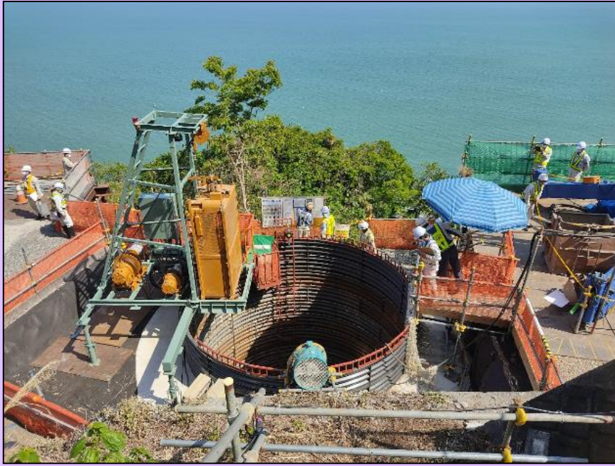
4月21日(水) 由比地区安全パトロール

由比地すべり対策事業の深礎杭の現場において、安全パトロールを実施しました。(静岡県 静岡市)