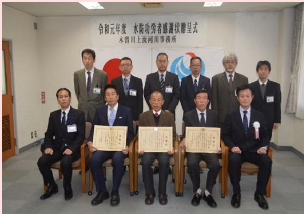
2月3日 木曾川上流河川事務所(岐阜県岐阜市)