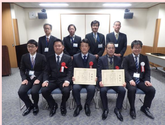
2月6日 木曾川下流河川事務所(三重県桑名市)