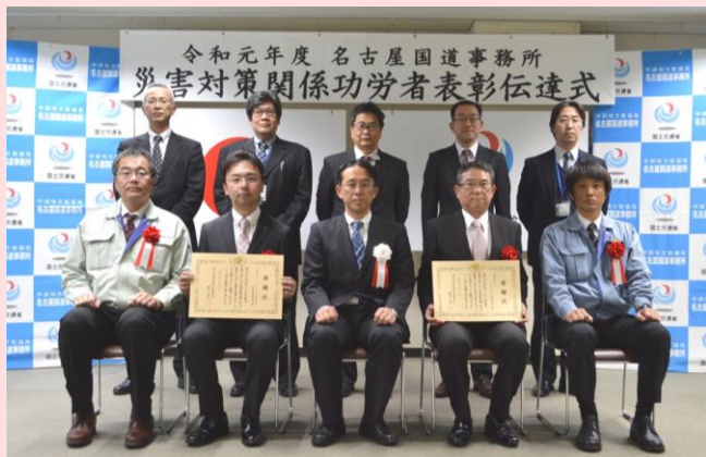
2月4日 名古屋国道事務所(愛知県名古屋市)