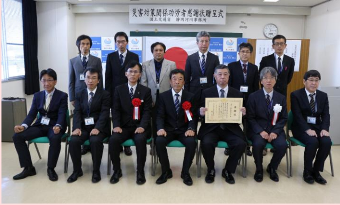
1月30日 静岡河川事務所(静岡県静岡市)

令和元年の九州北部豪雨や台風15号、台風19号などにおいて、災害対策や応急復旧にご尽力いただいた方々に中部地方整備局長、並びに事務所長から感謝状を贈呈させていただきました。