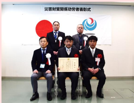
2月19日 飯田国道事務所(長野県飯田市)