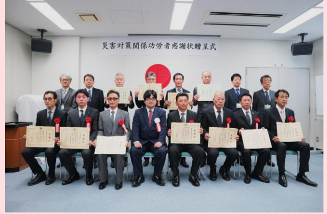
2月3日 庄内川河川事務所(愛知県名古屋市)