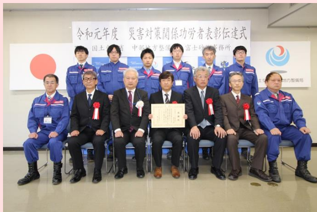
2月5日 富士砂防事務所(静岡県富士宮市)