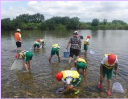
7月10日 豊橋市立賀茂小学校の皆さんと 豊川で水生生物調査を実施 豊川の下条橋上流で水生生物を採取し、豊川 の水質の状況を調査しました。 (愛知県豊橋市) 【豊橋河川事務所】