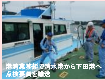
港湾業務艇で清水港から下田港へ 点検要員を輸送