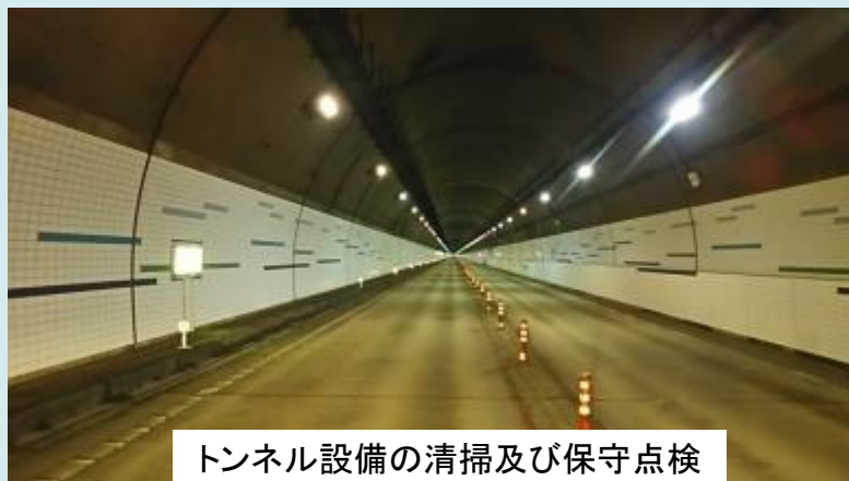
トンネル設備の清掃及び保守点検