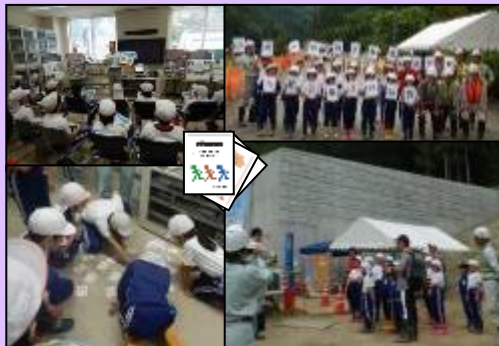
7月11日 小学生が砂防工事現場を見学 大鹿小学校3、4年生15名が滝沢第2砂防 えん堤、塩川床固工群工事現場を見学しま した。(長野県大鹿村) 【天竜川上流河川事務所】