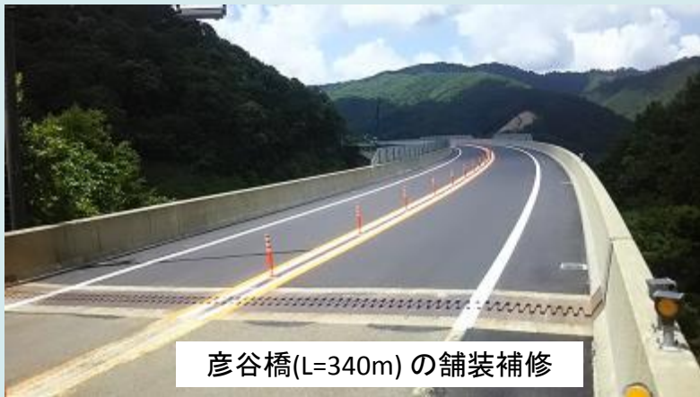
彦谷橋(L=340m)の舗装補修

地方公共団体管理の老朽橋梁に対する技術支援として、国の職員で構成する「道路メンテナンス技術集団」による現地調査に着手しました。(静岡県吉田町) 【中部道路メンテナンスセンター】