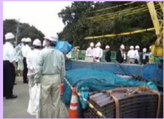
7月11日 日本建設情報総合センター(JACIC)の 皆さんが地すべり対策工事現場を視察 (一財)日本建設情報総合センター(JACIC)の皆 さん12名がCIM技術を活用した深礎杭の施工現場 等を視察しました。また視察後、CIMの今後の積極 的な活用について意見交換を行いました。 (静岡県静岡市) 【富士砂防事務所】