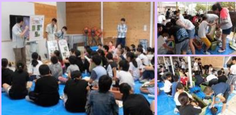
7月12日 尾鷲小学校の児童とヤマネの生態について学習 熊野尾鷲道路(Ⅱ期)の整備にあたり、ヤマネ(天然記念物)との共生に 取り組んでおり、平成28年から小学生とともにヤマネの学習をしていま す。(三重県尾鷲市) 【紀勢国道事務所】