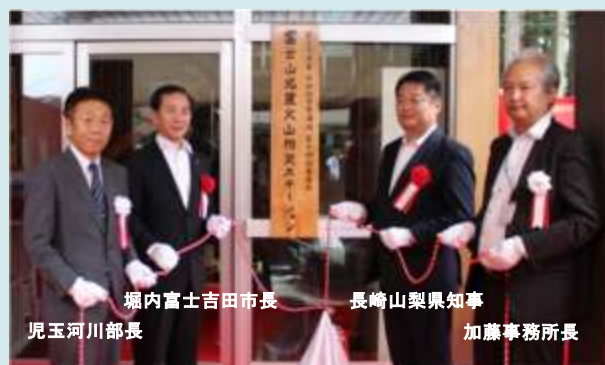
6月23日 富士山北麓火山防災ステーション 開所式

国直轄事業としては10年ぶりとなる地すべり対策 事業の着工式を開催しました。 (長野県天龍村) 【天竜川上流河川事務所】