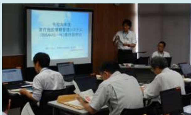
6月5日、10日、11日、12日 官庁施設情報管理システム(BIMMS-N) 操作説明会

地域振興施設「トマッテ」正面にて来賓者による テープカットを行いました。(愛知県豊橋市) 【名古屋国道事務所】