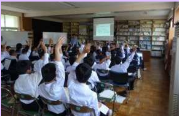
6月6日 富士宮市立北山中学校 出前講座

地すべり対策事業でのCIMの活用についてポスターを展示し、事務所職員が説明を行いました。 (神奈川県横須賀市) 【富士砂防事務所】