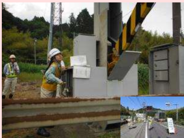
5月24日、31日 国道52号（静岡県静岡市） 【静岡国道事務所】