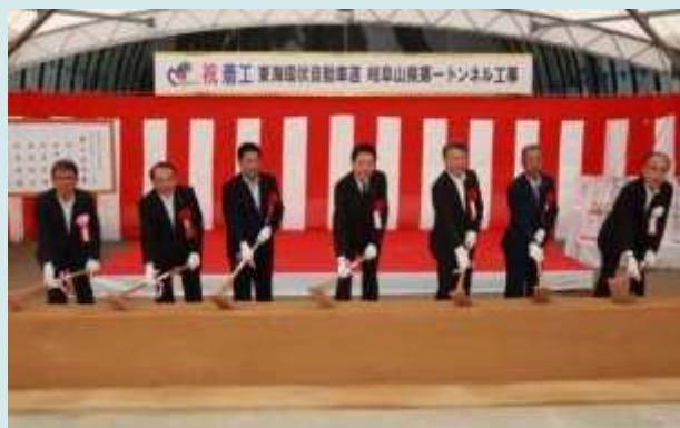
5月25日 東海環状自動車道 岐阜山県第1トンネル(仮称) (山県市側)着工式