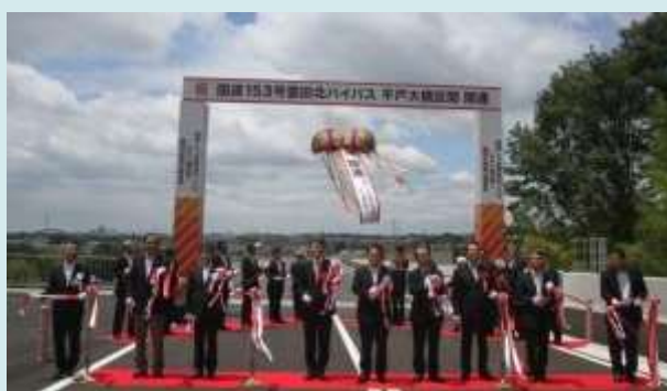
6月8日 国道153号豊田北バイパス 開通式典 ・セレモニーを開催

国の建物管理をする方を対象に、保全状況報告等 を行うシステム操作説明会を開催しました。 (愛知県名古屋市、静岡県静岡市) 【営繕部/静岡営繕事務所】