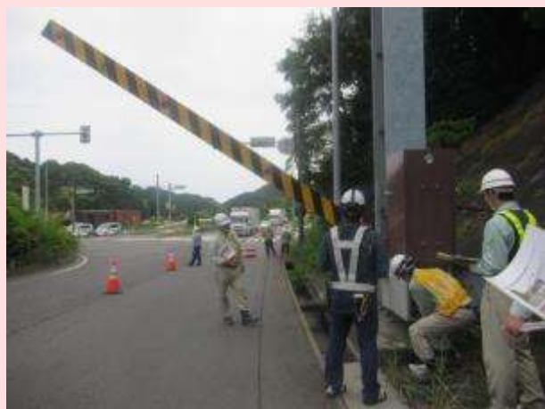
5月29日 国道1号（三重県亀山市） 【三重河川国道事務所】