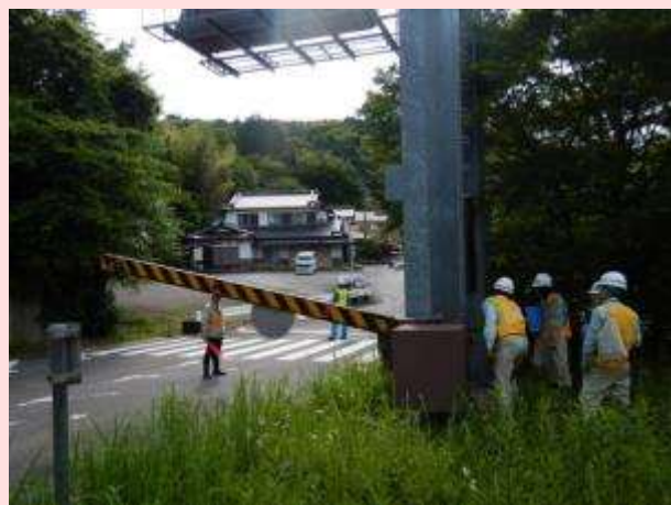
5月30日 国道1号（静岡県島田市）