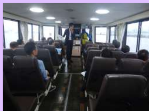
6月7日 関西国際航空貨物運送協会が清水港を視察 海上視察の様子(静岡県静岡市) 【清水港湾事務所】

富士宮市立北山中学校1年生52名を対象に富士山噴火をテーマに講義を行い、身近な富士山への関心を高める授業になりました。 (静岡県富士宮市) 【富士砂防事務所】