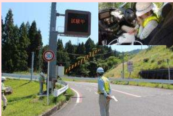
5月24日 国道25号名阪国道（三重県亀山市） 【北勢国道事務所】