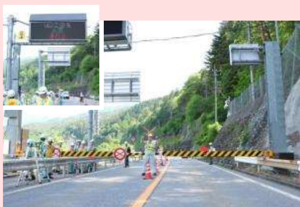
5月27日 国道41号（岐阜県高山市） 【高山国道事務所】