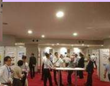
6月6日 第37回土砂災害防止「全国の集い」 in 神奈川

地すべり対策事業でのCIMの活用についてポスターを展示し、事務所職員が説明を行いました。 (神奈川県横須賀市) 【富士砂防事務所】