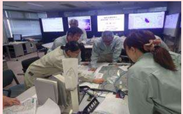
6月12日 堤防決壊時等の緊急対策シミュレーションを実施 洪水や大規模地震で堤防が決壊した場合の復旧方法などについて、演習を行いました。 (三重県桑名市) 【木曾川下流河川事務所】

梅雨を前に道路の危険箇所について現地防災点検を実施しました。(長野県阿智村・南木曾町) 【飯田国道事務所】