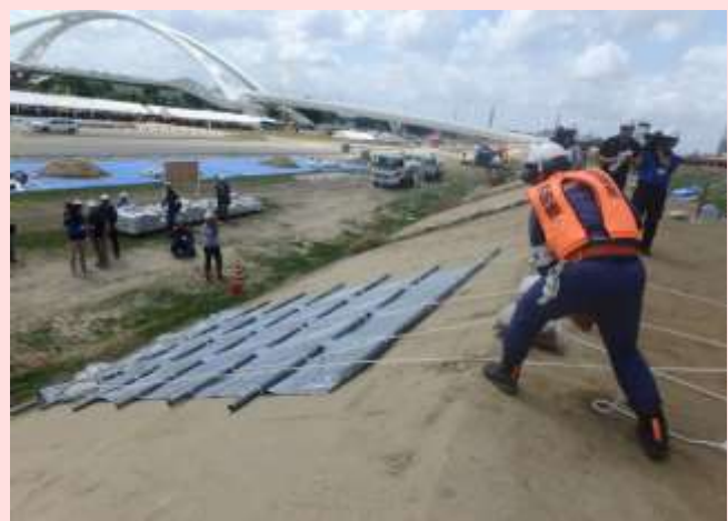
消防団による水防工法(シート張り工)