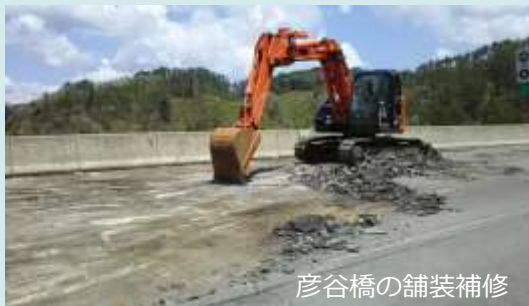
彦谷橋の舗装補修