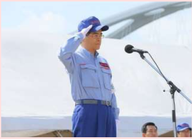
石井啓一国土交通大臣による開会の挨拶