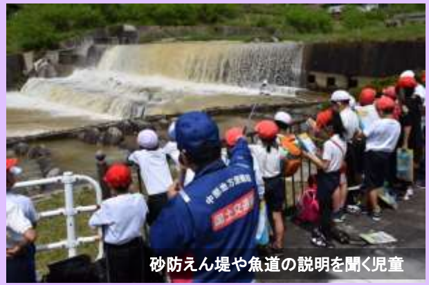
砂防えん堤や魚道の説明を聞く児童