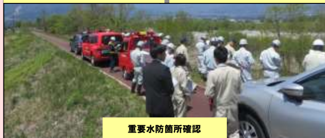
重要水防箇所確認