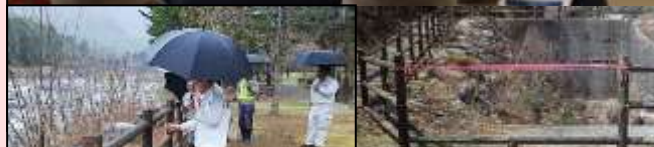
合同点検(危険箇所確認)