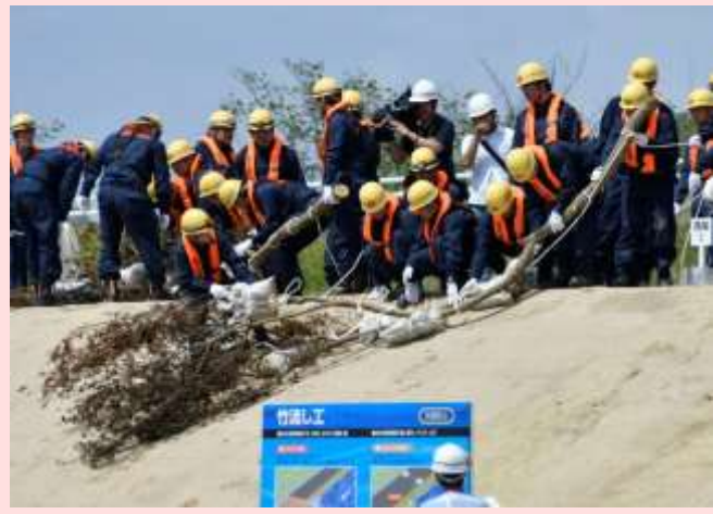
消防団による水防工法(竹流し工)