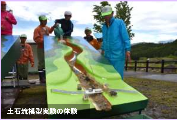
土石流模型実験の体験