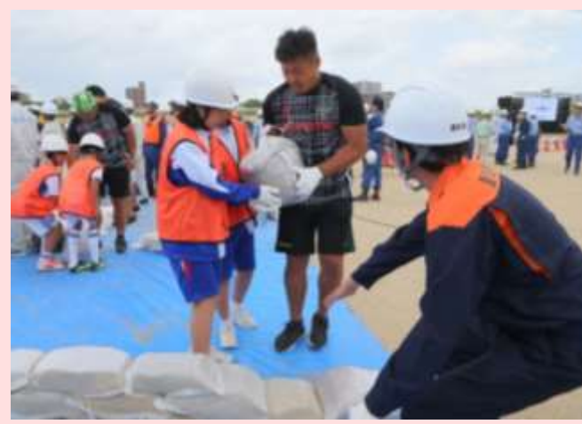
小学生・ラグビー選手による水防工法体験