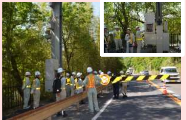
5月23日 国道19号通行規制箇所(遮断機)の操作訓練 岐阜・長野県境で、事前大雨通行規制訓練を実施しました。 (岐阜県中津川市) 【多治見砂防国道事務所】