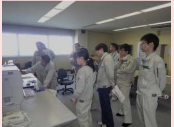
5月16日 勢田川防潮水門で水門操作訓練 (三重県伊勢市) 【三重河川国道事務所】