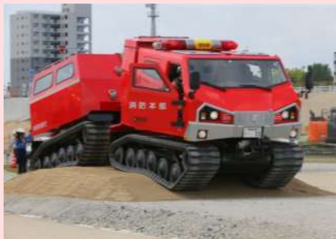
レッドサラマンダーによる捜索・救助訓練