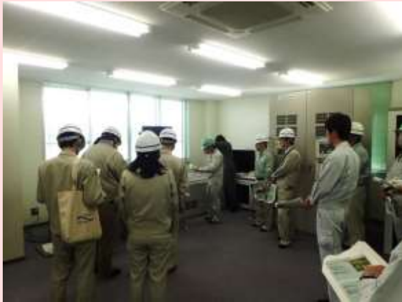
5月15日 櫛田可動堰で水門操作訓練 (三重県松阪市) 【三重河川国道事務所】