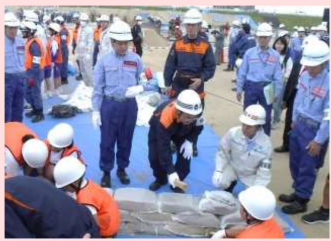
大臣の質問に答える小学生

5月19日 2019年 豊川・矢作川連合総合水防演習・広域連携防災訓練を開催 「地域の多様な力、絆を結集～三河地域最大規模の演習～」 (愛知県豊田市) 【豊橋河川事務所】