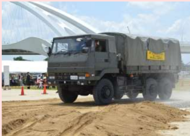
陸上自衛隊による物資運送訓練