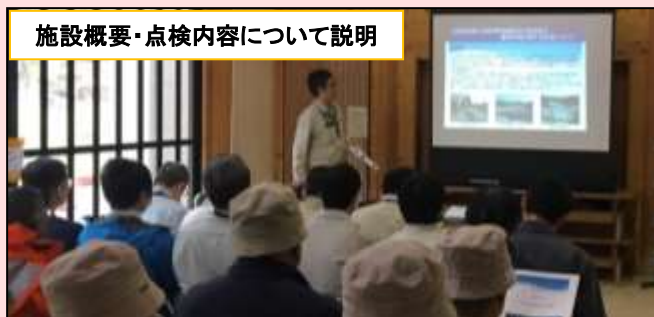
施設概要・点検内容について説明