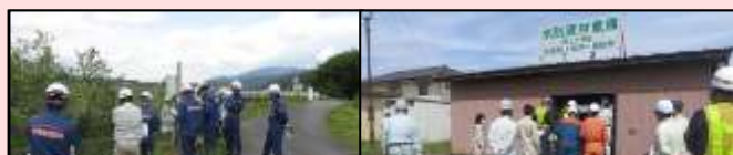
危機管理型水位計の説明