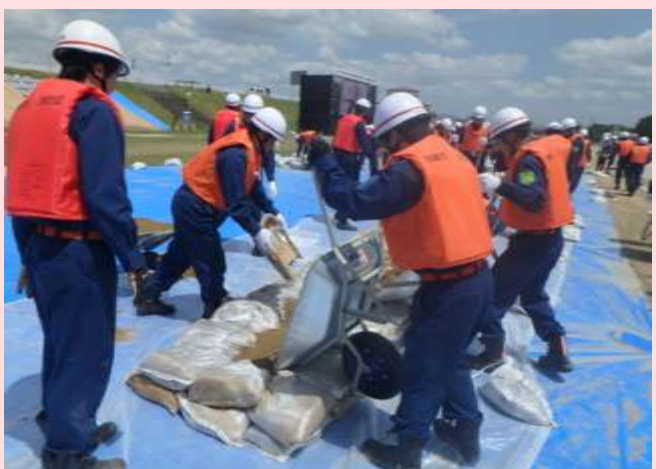
消防団による水防工法(積み土のう工)