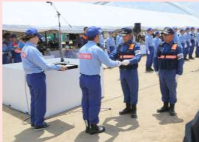
閉会式における消防団総指揮者への感謝状贈呈