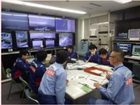
4月23日 洪水対応演習 (静岡県富士宮市) 【富士砂防事務所】