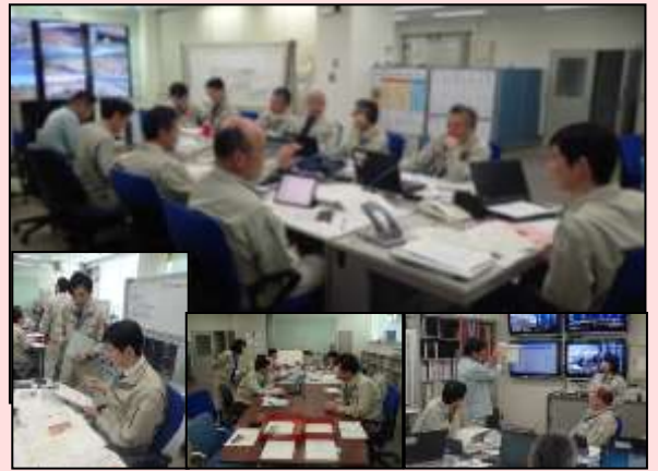
4月23日 洪水対応演習 (長野県駒ヶ根市) 【天竜川上流河川事務所】