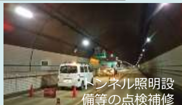
トンネル照明設 備等の点検補修