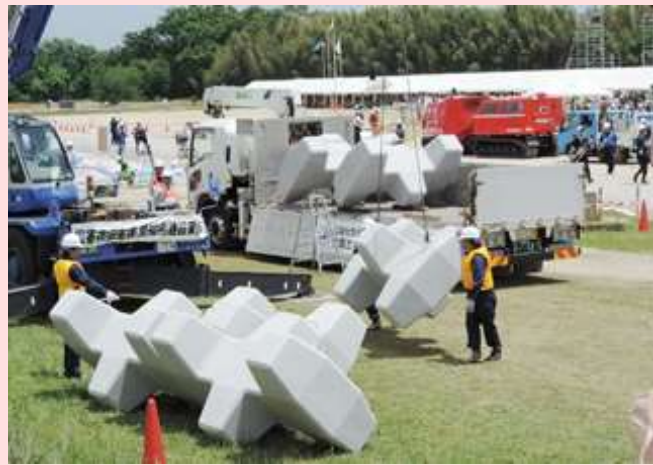
愛知県建設業協会・全国土木コンクリートブロック協会 による堤防決壊の荒締め切り