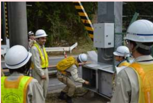
4月23日 国道153号通行規制箇所(遮断機)の操作訓練 事務所職員が遮断機操作訓練を実施しました。 (愛知県豊田市) 【名古屋国道事務所】