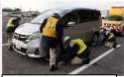
簡易移動ジャッキによる移動作業の様子

啓発チラシの配布・除雪関係車両の展示も実施しました。(静岡県富士宮市) 【静岡国道事務所】