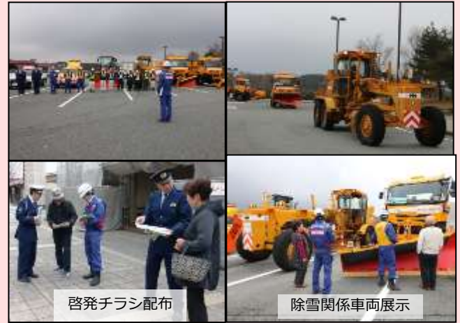
11月29日 雪氷出陣式を開催

雪氷対策出発式にて受注業者が安全宣言を行いました。(愛知県豊田市 稲武雪寒基地) 【名古屋国道事務所】