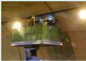
照明器具清掃・管球取替