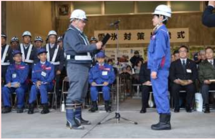
11月27日 雪氷対策出発式

雪氷対策出発式にて受注業者が安全宣言を行いました。(愛知県豊田市 稲武雪寒基地) 【名古屋国道事務所】