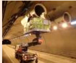
換気設備点検(ジェットファン)