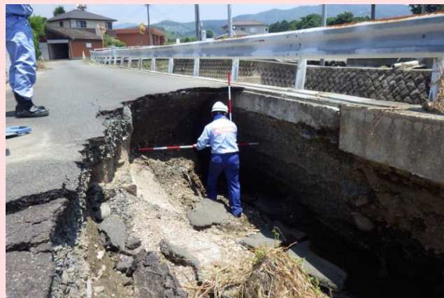
7月13日 朝倉市入地市道被災状況調査 (道路調査班)