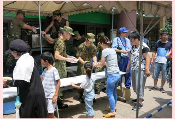
7月17日 広域避難訓練の実施② 避難後、陸上自衛隊による炊き出し (木曾川下流河川事務所)