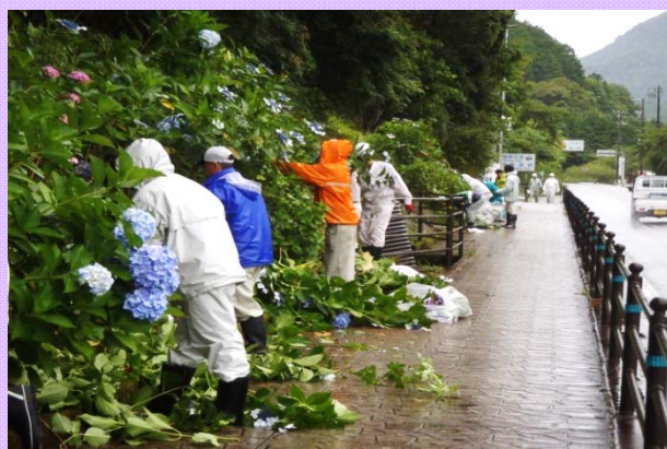
7月1日 道路協力団体の活動報告 国道42号の尾鷲市と紀北町で歩道沿いの 植栽帯のあじさいを剪定しました (紀勢国道事務所)