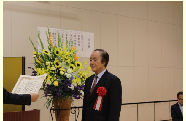
7月20日 優良工事等の「事務所長表彰式」の開催② 事務所長より表彰状の授与 (清水港湾事務所)