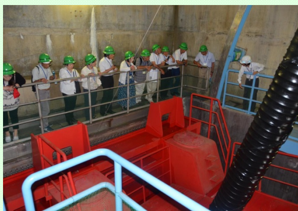
7月7日 社会教育委員がダム視察 榛原地区(牧之原市・吉田町・川根本町)の社会教育委員がダムを視察しました(見学者数：35名) (長島ダム管理所)