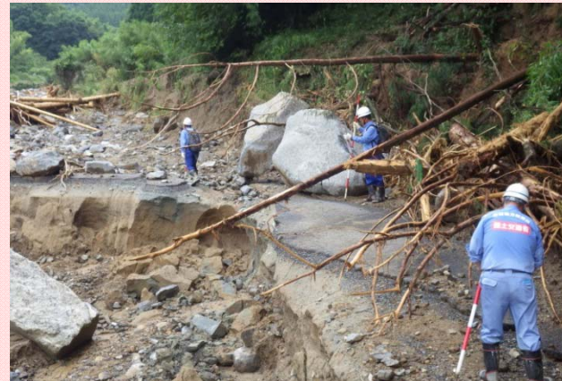
7月12日 朝倉市杷木古賀地区被災状況調査 (砂防調査班)