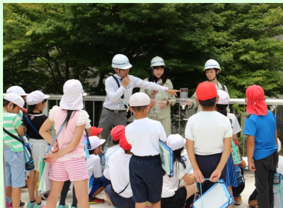
7月11日 小里川ダム見学① 恵那市立山岡小学校の児童がペットボトルを使った実験でダムの役割を学習しました