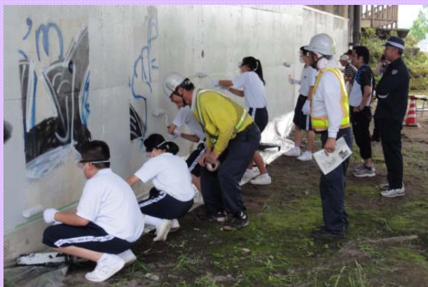
7月10日 恵那市立恵那東中学校、恵那西中学校の生徒15人に 恵那大橋橋脚の落書き消しをしていただきました (多治見砂防国道事務所)