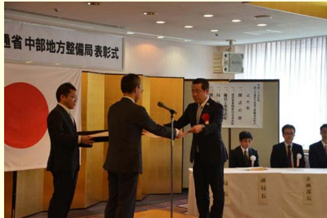
7月19日 中部地方整備局表彰式典を開催 ～工事・業務における優秀企業・技術者の皆さまを表彰～ 塚原局長より表彰状を授与 (中部地方整備局)