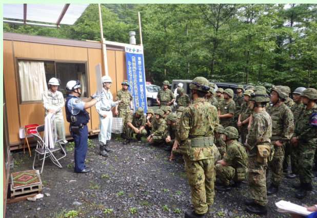
7月12日 自衛隊、防衛大学校生による「大谷崩」現地視察 陸上自衛隊第34普通科連隊30名と防衛大学3年生10名が、訓練の一環で「大谷崩」(静岡市葵区梅ヶ島)の現地を視察をしました。 (静岡河川事務所)