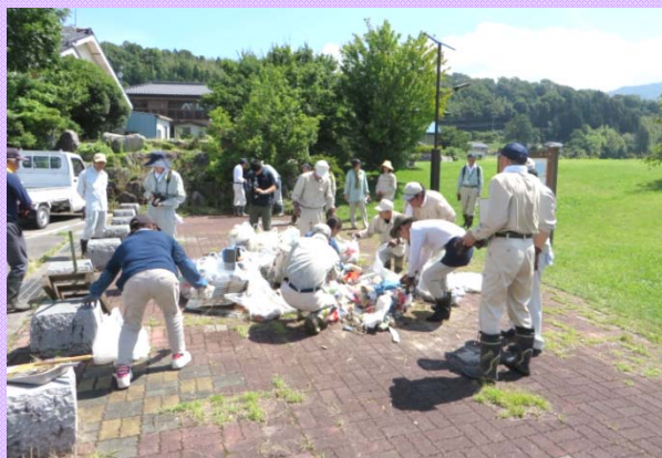
7月6日 中川村にて河川清掃を実施 中川村役場職員や住民の皆さんと協力し、 堤防沿いのゴミの回収や特定外来植物 (オオキンケイギク、アレチウリ)の駆除を行いました (天竜川上流河川事務所)