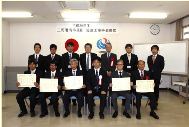
7月21日 優良工事等の「事務所長表彰式」の開催① 優秀な成績を収められた企業・技術者の皆様 (三河港湾事務所)