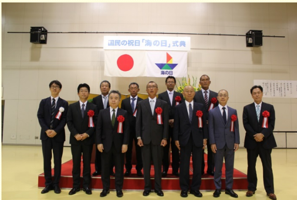
7月20日 優良工事等の「事務所長表彰式」の開催① 優秀な成績を収められた企業・技術者の皆様 (清水港湾事務所)