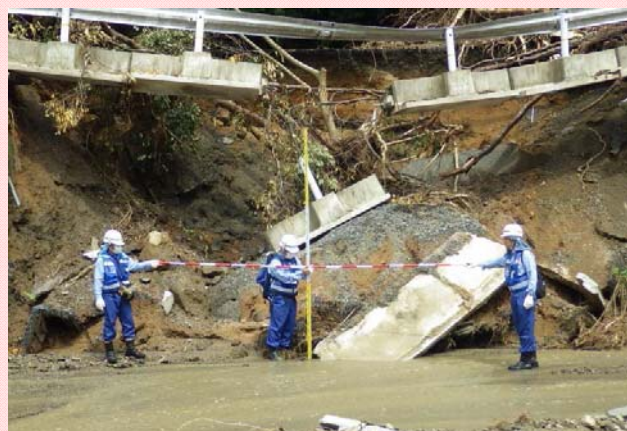
7月19日 朝倉市奈良ヶ谷川被災状況調査 (河川調査班)