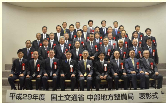
7月19日 優良工事表彰式 優秀な成績を収められた企業のみなさま。 受賞おめでとうございます。 (中部地方整備局)