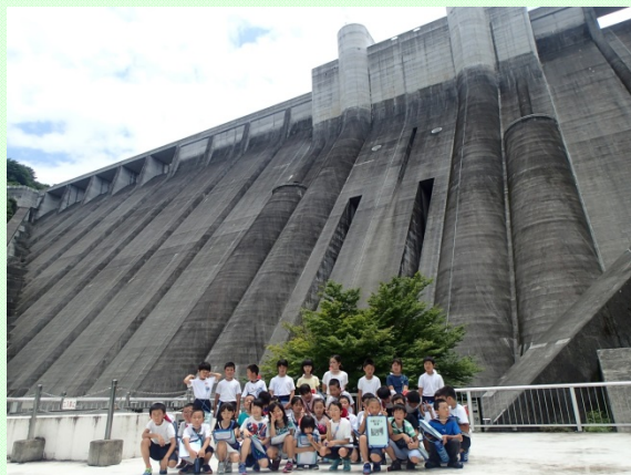
7月11日 小里川ダム見学② 小里川ダムをバックに記念撮影 (庄内川河川事務所)