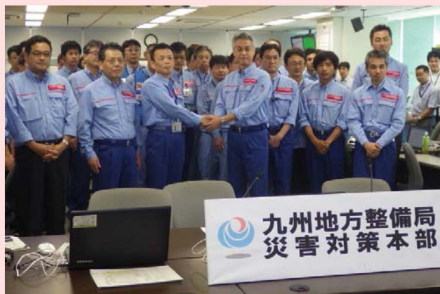
7月20日 九州地方整備局長へ活動状況を報告 (中部地方整備局)