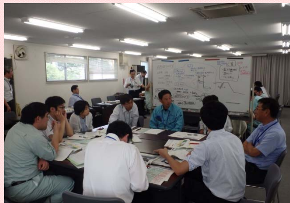
6月28日 堤防決壊時等の緊急対策シミュレーション 台風期に向け、堤防決壊に備えた訓練を実施 (三重河川国道事務所)