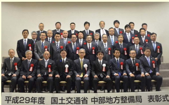
7月19日 優良業務表彰式 優秀な成績を収められた企業のみなさま。 受賞おめでとうございます。 (中部地方整備局)