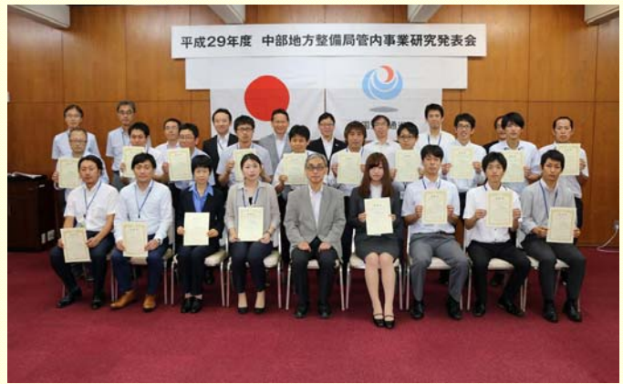
7月7日 管内事業研究発表会 受賞されたみなさん。受賞おめでとうございます。 (中部地方整備局)