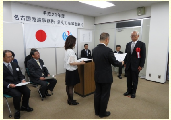
7月21日 優良工事等の「事務所長表彰式」の開催② 事務所長より表彰状の授与 (名古屋港湾事務所)