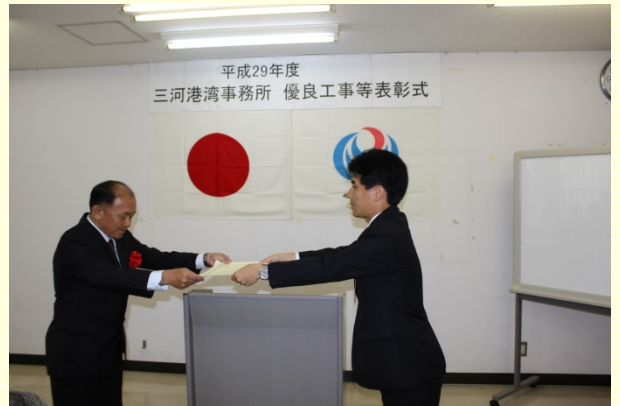
7月21日 優良工事等の「事務所長表彰式」の開催② 事務所長より表彰状の授与 (三河港湾事務所)