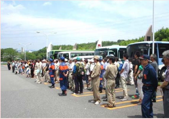
7月17日 広域避難訓練の実施① 桑名市など木曾川下流域8市町村の 住民約180名がバスにより高台に避難 (木曾川下流河川事務所)