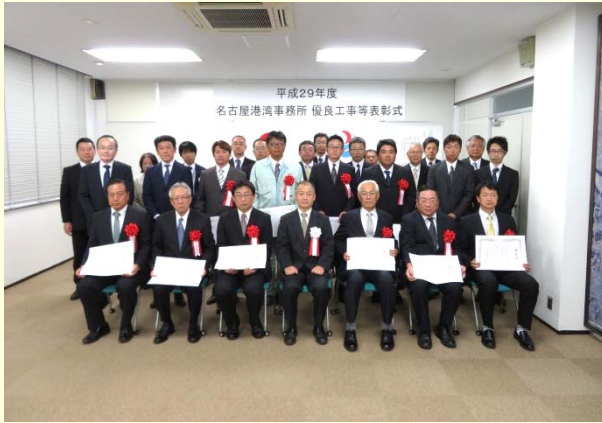
7月21日 優良工事等の「事務所長表彰式」の開催① 優秀な成績を収められた企業・技術者の皆様 (名古屋港湾事務所)