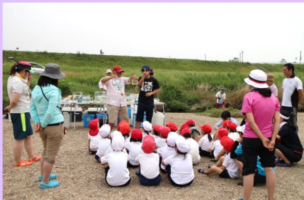
6月27日 「矢田川子どもの水辺」で総合学習(河川環境) 愛知県立千種聾学校の生徒が 水生生物調査を学習しました (庄内川河川事務所)