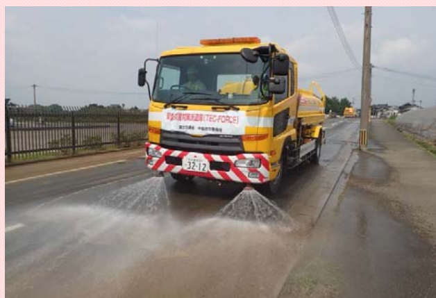
7月20日 朝倉市石成・比良松地区にて散水作業 (応急対策班)