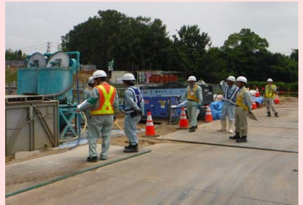
6月29日 合同工事安全パトロールを実施 153・155号豊田南北バイパス工事の安全・衛生の推進 のため(一社)愛知道路災害対策協力会と合同で実施 (名四国道事務所)