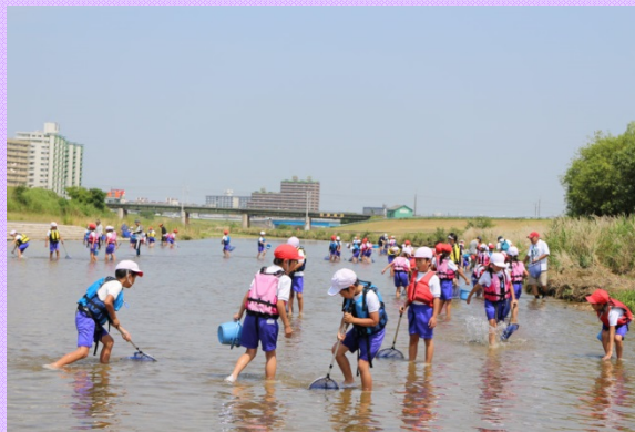
6月23日 「矢田川子どもの水辺」で総合学習(河川環境) 名古屋市立廿軒家小学校の生徒が 水生生物や水質の調査を学習しました (庄内川河川事務所)