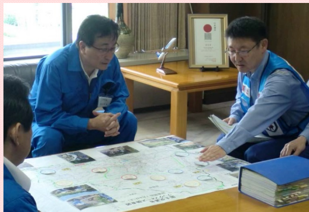
7月18日 日田市長へ被災状況調査を中間報告 (砂防調査班)