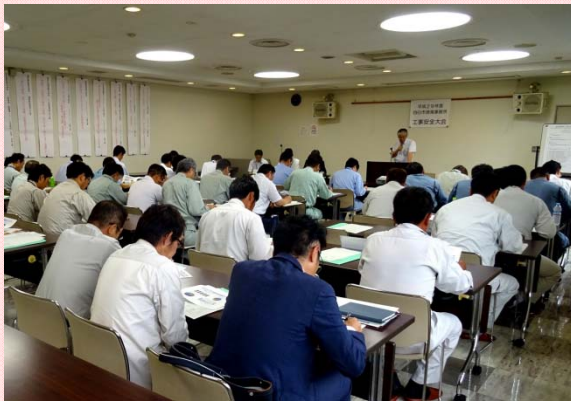
7月14日 工事安全大会を開催 工事の無事故・無災害を目指し、安全意識の 向上を図る (四日市港湾事務所)