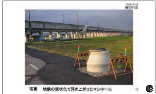
写真 地盤の液状化で浮き上がったマンホール