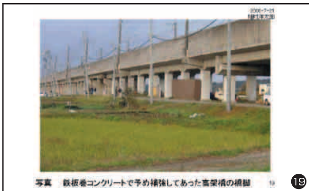
写真 鉄板巻コンクリートで予め補強してあった高架橋の橋脚