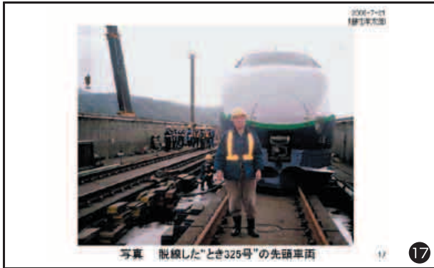
写真 脱線した“とき325号”の先頭車両