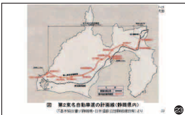
図 第2東名自動車道の計画線(静岡県内) (『基本構想書(静岡県・日本道路公団静岡建設局)より