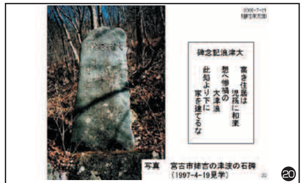
写真 富士市姉吉の津波の石碑 (1997-4-19見学)