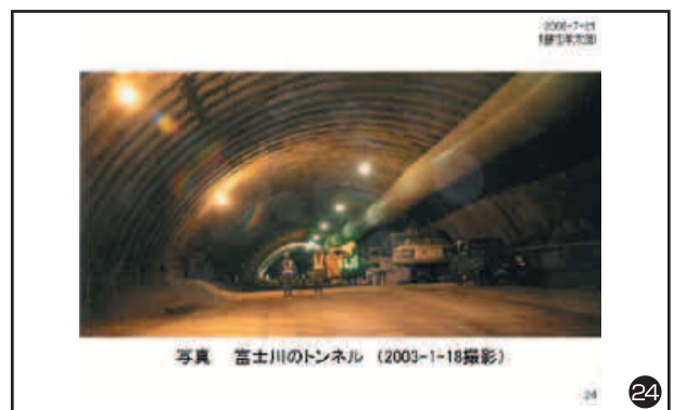
写真 富士川のトンネル (2003-1-18撮影)