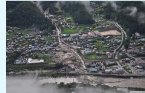
平成26年南木曾町梨子沢土石流(土砂被害)