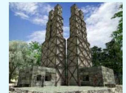
世界遺産・葦山反射炉