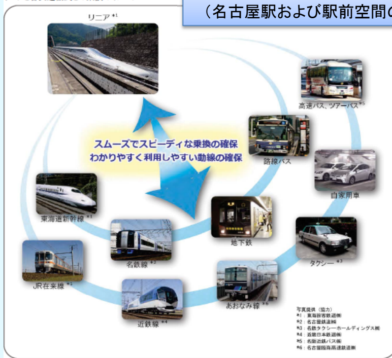
リニアと各交通機関との乗換のイメージ