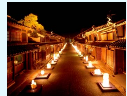
うだつの上がる街並み(美濃市)