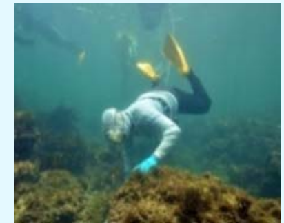
海女漁(鳥羽・志摩市)