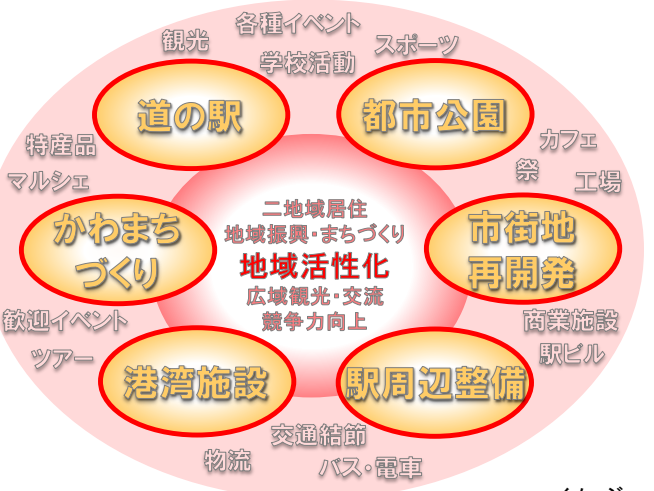
- イメージ -