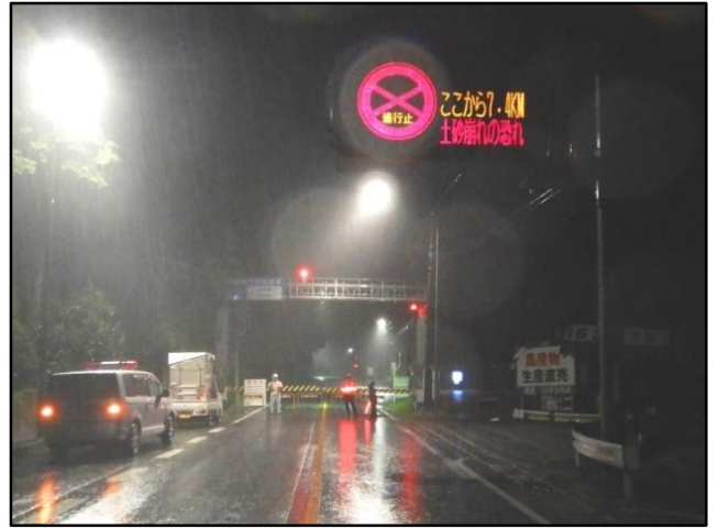
小田木遮断機を使用した夜間通行止の様子(H30.9.5)