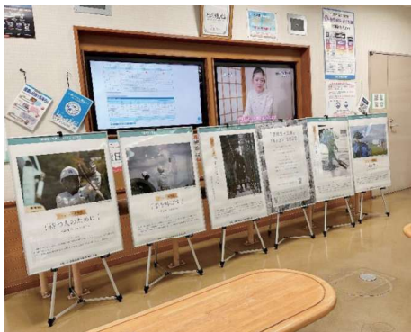
道の駅 どんぐりの里いなぶ