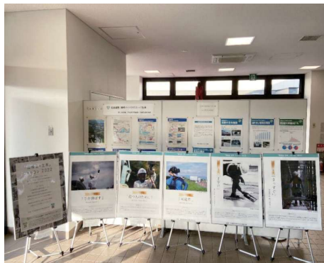
道の駅 にしお岡山