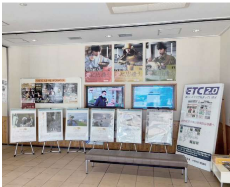
道の駅 筆柿の里幸田