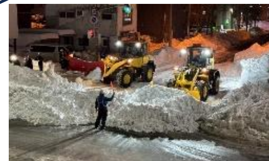
①市道からの押し出し