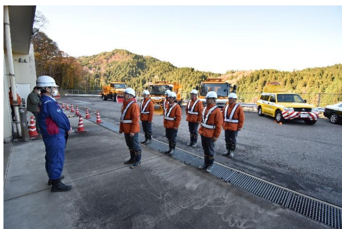
受注者による安全宣言