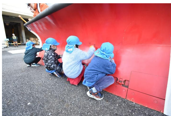
雪かき部へのお絵描き