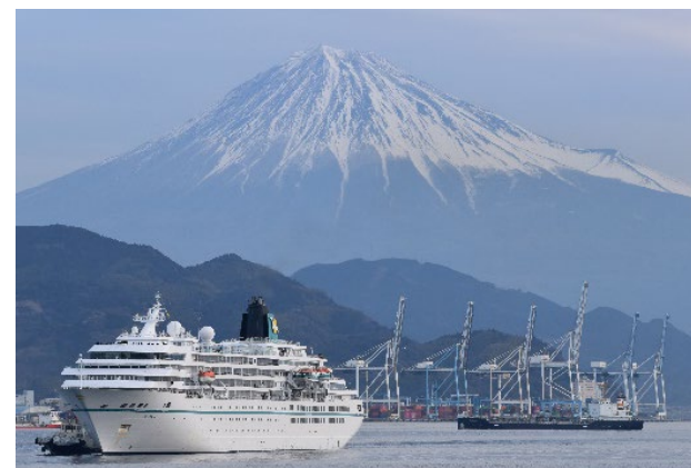
コロナ禍後、外国クルーズ船受入再開第1号の客船「アマデア」が清水港に寄港(2023年3月1日)