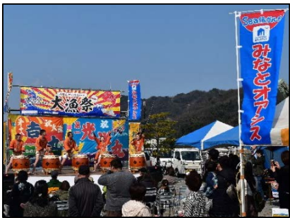
地域振興イベントの開催状況