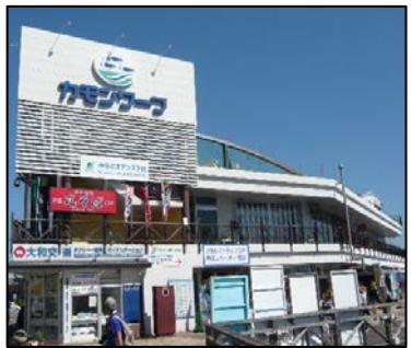
構成施設のイメージ