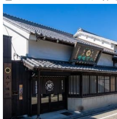
(株)まるや八丁味噌事務所棟