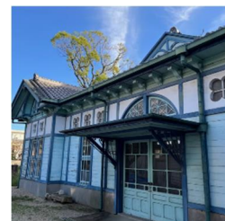
旧額田郡物産陳列所