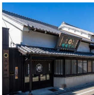
株まるや八丁味噌事務所棟

岡崎城旧本丸に位置し、諸願成就や開運守護のお社として信仰される神社。祭神は徳川家康公、本多忠勝朝臣、天神地祇、護国英霊。