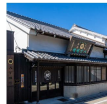
(株)まるや八丁味噌事務所棟

この取組は国土交通省とNianticとの連携によるものです。 「歴史まちづくり」「歴史的風致維持向上計画」および 『Pokémon GO』および「ポケストップ」等の詳細については、 添付の国土交通本省のプレスリリースをご覧ください。