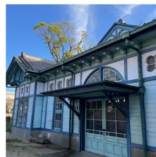
旧額田郡物産陳列所

江戸時代初期より豆味噌を造り続ける老舗のひとつ「まるや」の事務所棟。旧東海道の町家の意匠を残す。第 6 号岡崎市景観重要建造物。