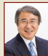
山下 正行 伊豆の国市長