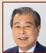
豊岡 武士 三島市長