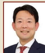
中村 健 西尾市長