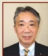
松雄 俊憲 名古屋副市長