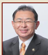
中根 康浩 岡崎市長