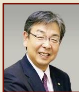
櫻井 義之 亀山市長