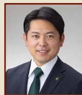
柴橋 正直 岐阜市長