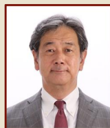
田中 明 高山市長