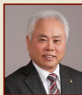
武藤 鉄弘 美濃市長