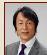
岡本 栄 伊賀市長