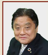
河村 たかし 名古屋市長