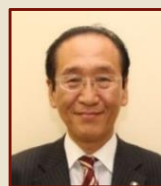
日比 一昭 津島市長