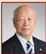
日置 敏明 郡上市長