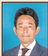
原 欣伸 犬山市長