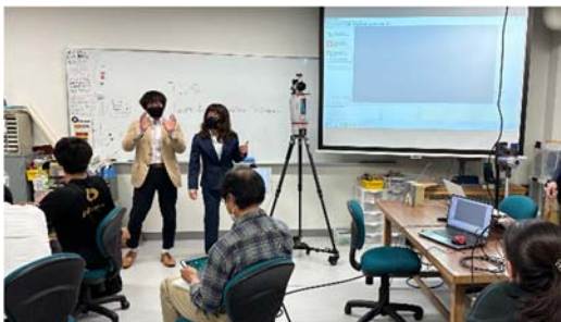
地上レーザースキャナー実演