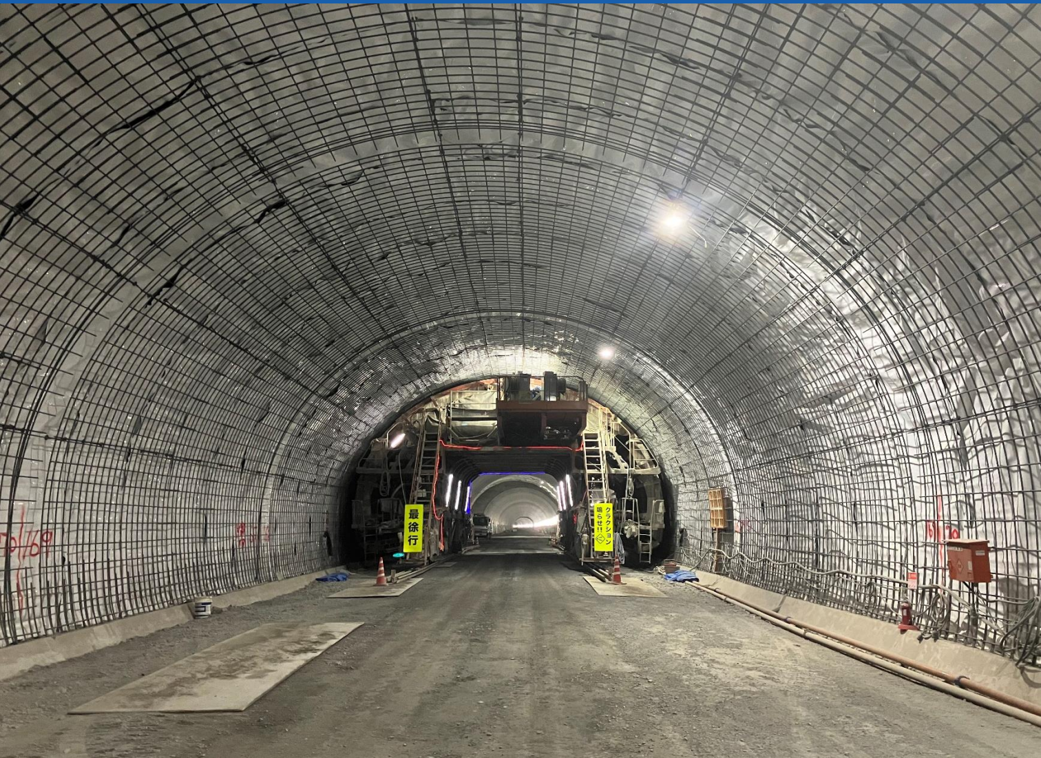
三遠南信自動車道 青崩峠道路トンネル内部工事（長野県）