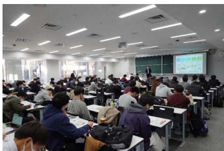
建設ICTの専門家による講義